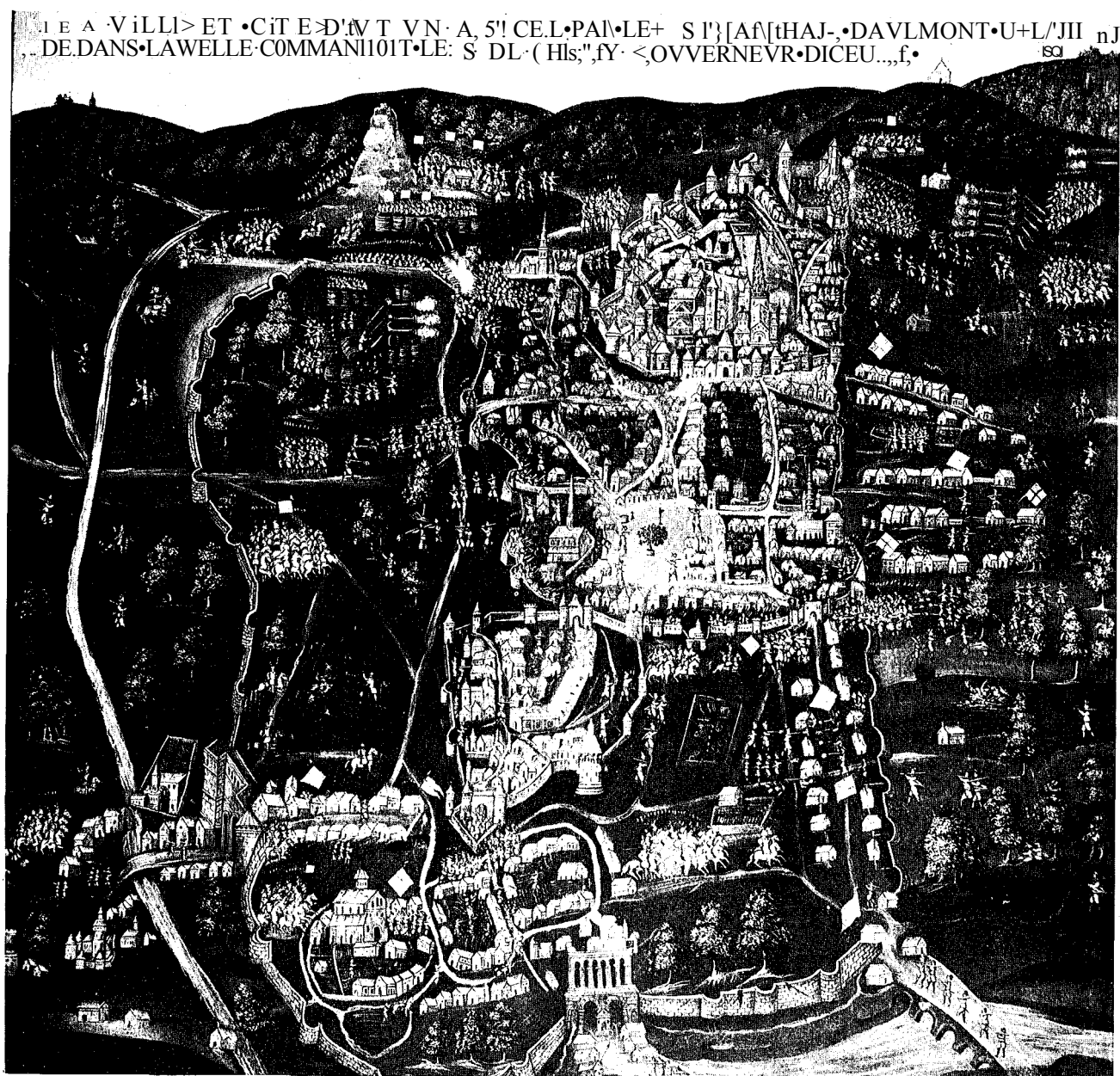
La ville et cité d'Autun assiégée par le Maréchal d'Aumont en 1591; tableau anonyme, Bourgogne, début XVII e . Huile sur toile Musée Rolin Autun

Légèrement postérieure, une vue cavalière de Pierre Tranchant, datée de 1660, montre la ville vue de l'ouest. Elle apporte peu d'éléments au regard des deux oeuvres précédentes mais on y remarque le bon état de l'ensemble de la courtine et des tours ainsi que de nouvelles couvertures sur les tours situées au nord-est, le long de l'actuelle route d'Arnay.