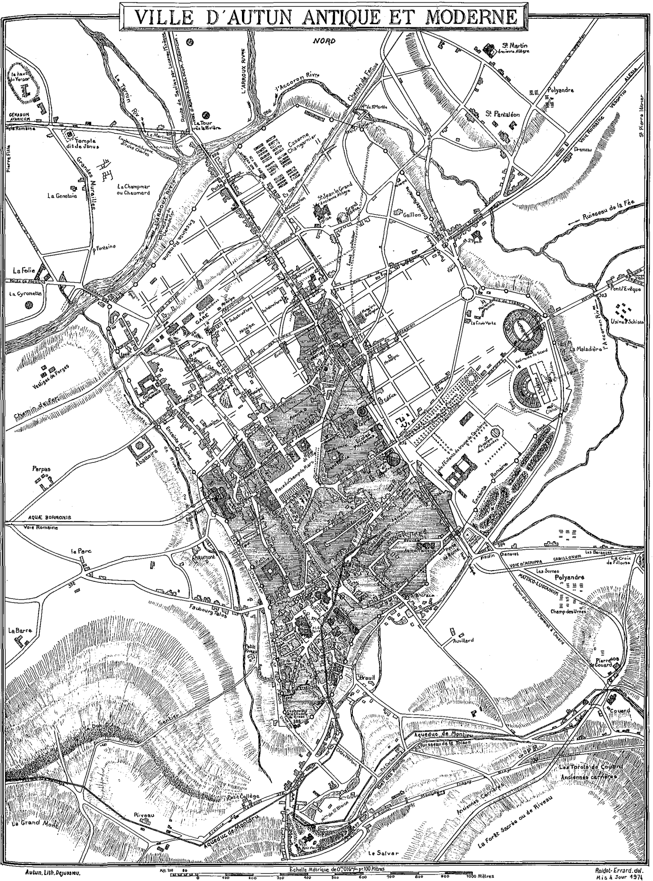
Plan d'Autun antique et moderne, par Jean Roidot-Errard, extrait de H. de Fontenay, Autun et ses monuments. Autun. 1889 (mise à jour 1974)