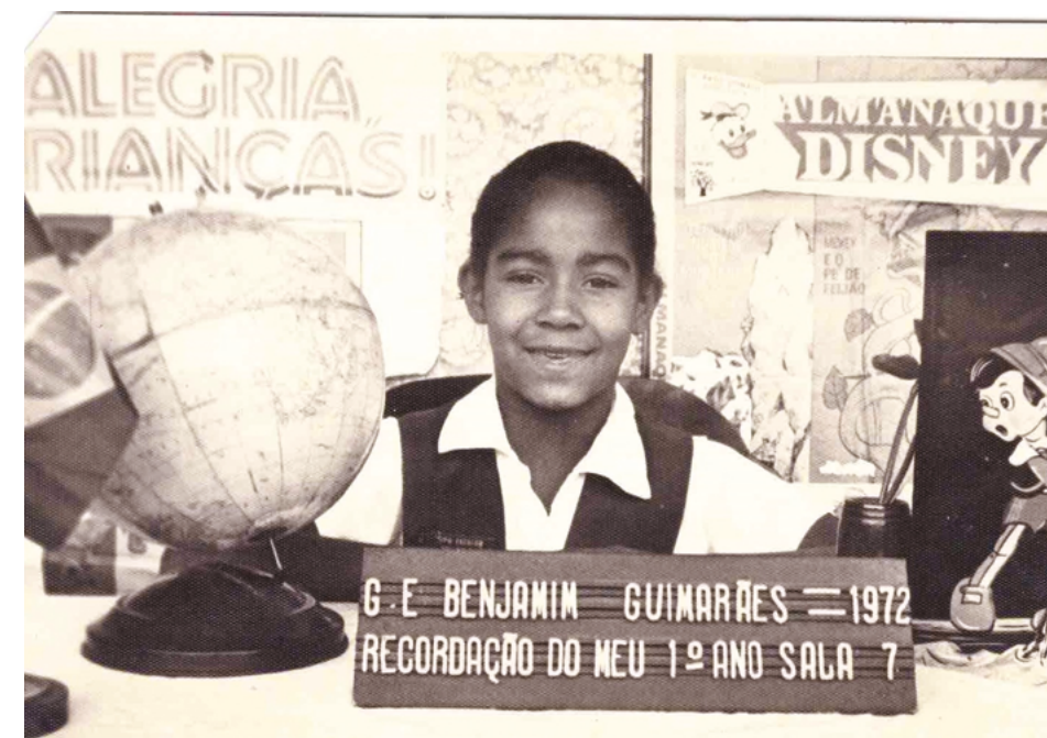
Primeiro Ano na escola do bairro Concórdia.

Nos primeiros anos do ensino fundamental, estudei na Escola Estadual Benjamin Guimarães, que também ficava no bairro. Era um pouco mais longe, mas também ia sozinha e chegava cedo. Eu adorava estudar, nunca faltava. Não lembro de ter faltado até a terceira série, pois mesmo doente eu ia para a escola. Aprendi a ler cedo, fui uma das primeiras da turma a aprender, gostava de ler histórias. Escrevi uma redação que participou de um concurso da Secretaria de Educação e foi