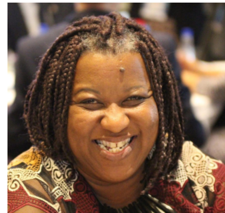
Ano: 2017.