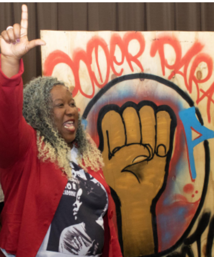
Macaé no Conselho dos Secretários Estaduais de Educação, 2018.

Meu primeiro contato com o ativismo político vai se dar no interior, no âmbito dos movimentos de igreja, com as Comunidades Eclesiais de Base (Cebes), as pastorais de juventude e os agentes de pastorais negros. Na minha cidade do interior tinha muitos grupos de jovens que me despertaram para a política. Ainda na adolescência, ganhei de um amigo um livro maravilhoso que se chama Si me permiten hablar , um livro sobre a história da líder Domitila Barros Chungara, que foi uma líder operária, muito humilde e que trabalhava na mineração. Ela vai travar uma grande luta na Bolívia e dedicar toda sua vida à luta pelos direitos das pessoas na mineração e pelas famílias pobres. O livro me marcou profundamente, porque era a história de uma mulher do povo, sobre a luta contra o imperialismo e a organização das mulheres.