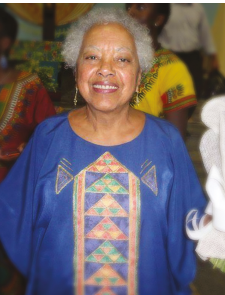
Diva na Igreja Jesus Crucificado, participando de festividades do Rosário. Belo Horizonte, 2016.