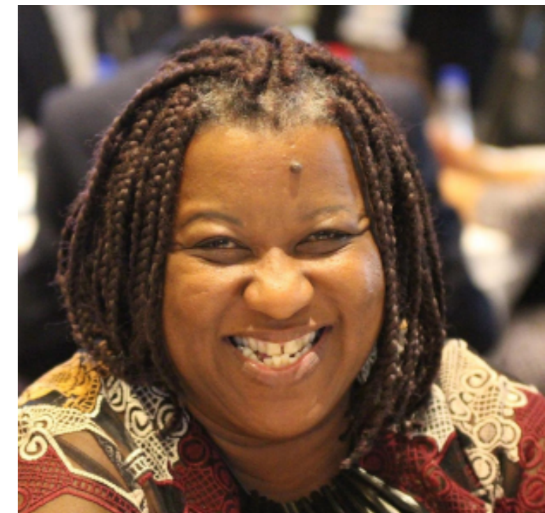
Ano: 2017.