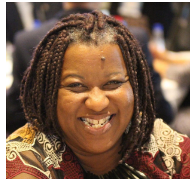
Ano: 2017.