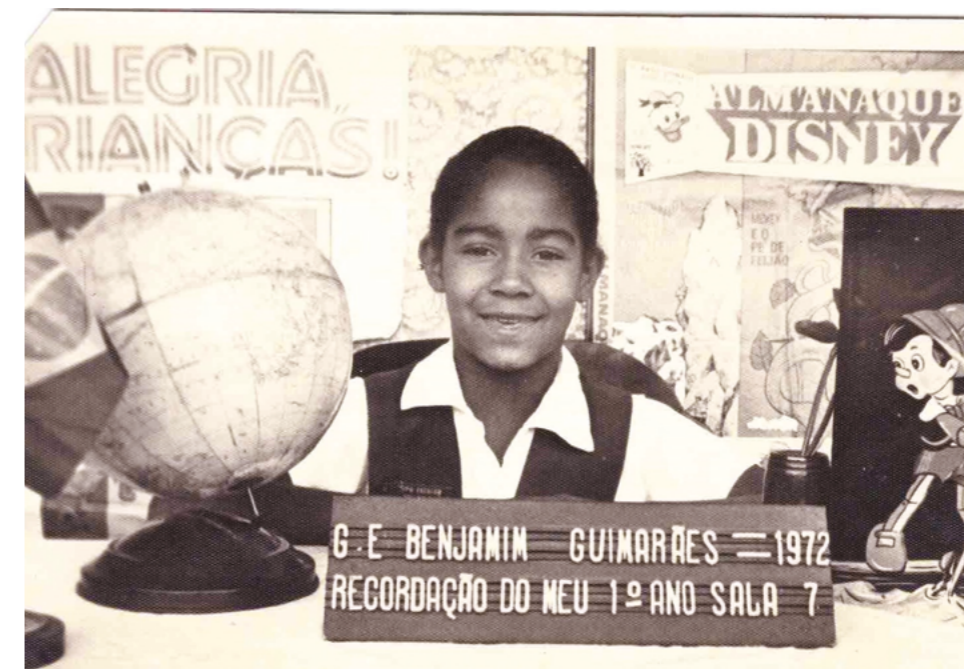
Primeiro Ano na escola do bairro Concórdia.

Nos primeiros anos do ensino fundamental, estudei na Escola Estadual Benjamin Guimarães, que também ficava no bairro. Era um pouco mais longe, mas também ia sozinha e chegava cedo. Eu adorava estudar, nunca faltava. Não lembro de ter faltado até a terceira série, pois mesmo doente eu ia para a escola. Aprendi a ler cedo, fui uma das primeiras da turma a aprender, gostava de ler histórias. Escrevi uma redação que participou de um concurso da Secretaria de Educação e foi