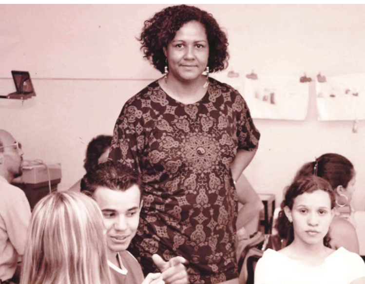
Aula-oficina sobre relações raciais. Belo Horizonte, 2005.

Eu resolvi me candidatar à diretoria da escola, junto com outra colega, uma professora negra. Foi um processo bem difícil, a gente sofreu racismo e toda forma de preconceito e discriminação. Essa colega, que se candidatou comigo, até o fato de ela ter cinco filhos foi levado para os debates: