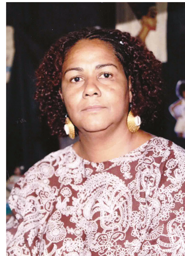
Diretora da Escola Municipal Florestan Fernandes. Belo Horizonte, 2008.

E eu gostaria de ser lembrada como uma professora negra que dedicou a vida a toda à discussão racial e por toda a minha trajetória, que começou muito cedo. Por uma vida de entrega e também de muito envolvimento. Quero ser lembrada como a professora negra que se envolveu e dedicou uma vida às questões de justiça racial e de luta antirracista.