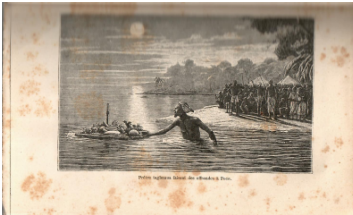
Imagen 4 : Ilustración reproducida en Alfred Marche, Six années de Voyages aux Philippines , París, Librairie Hachette, 1887, p. 406 Véase chap. XV: Les Tagbanuas - Moeurs et Coutumes, pp. 319-333.