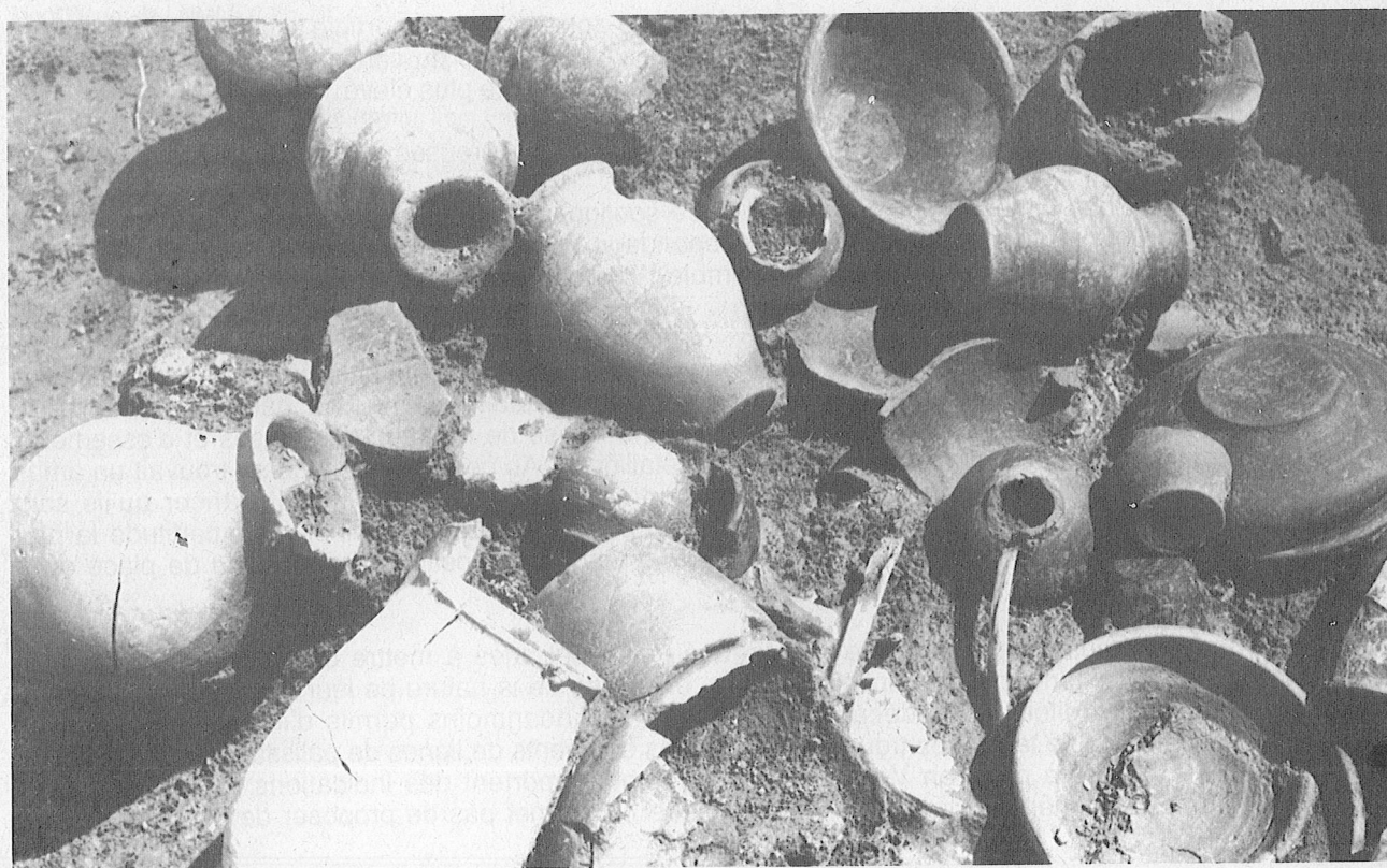
Dépôts de céramiques.