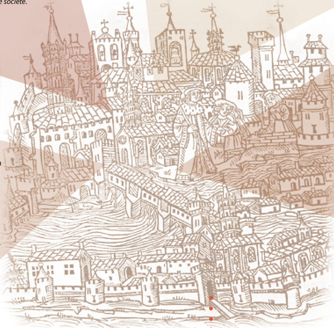
illustration : Nicolas Bertrand, Opus de Tholosanorum gestis ab urbe condita, Tholose : Industria Magistri Johannis Magni-Johannis, 1515. Gravure sur bois, 25 x 19 cm. Ville de Toulouse, Bibliothèque d'Etude et du Patrimoine, Res. B XVI 318 ou Archives municipales, RES343. Domaine public.

Dans le cadre du projet PRISMEO, ce regard questionne le processus de conception d'un espace en partant de la sensibilité des habitant-e-s, de leur récit de vie et non plus du postulat des champs disciplinaires que les musées.