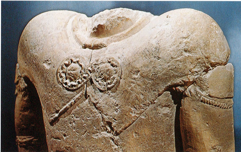
1 Torse au "pectoral" ouvert. Entremont, II e s. av. J.-C.