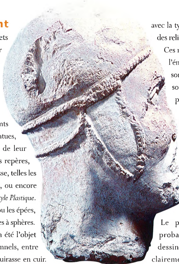
8 Tête de guerrier casqué découverte à Entremont et conservée au Musée Granet

Dans leur majorité, les équipements et accessoires du costume témoignent aussi d'une phase de création initiale des sculptures remontant à l'articulation des IV e et III e siècles, soit La Tène B2 des chronologies en usage pour la Celtique centrale. L'évolution relative des figurations de guerrier permet de supposer une production continue jusqu'au milieu du III e siècle. La phase terminale de l'ensemble en ronde bosse se traduit par un nouveau style de figuration toujours grandeur nature : les statues équestres. Leur armement, parfaitement réaliste, correspond aux équipements de la fin du III e siècle, soit la fin de la phase La Tène C1. Les analyses stylistiques révèlent une diachronie parfaitement cohérente