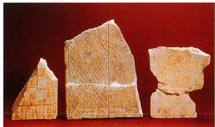
7 Fragments de dossières gravées et peintes issues des fouilles anciennes et récentes de Roquepertuse