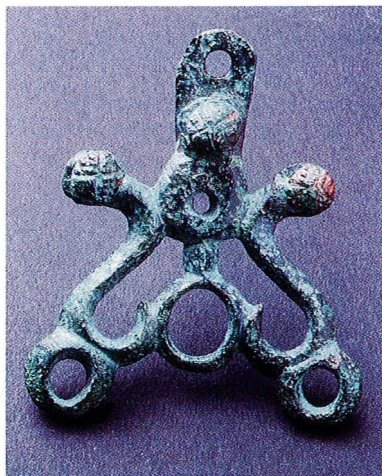
2 Élément de harnachement celtique. La Cloche, I er s. av. J.-C.

pas fabriquer le mortier, se contentaient de terre sèche ou d'argile. C'est seulement dans le Midi, dans ces centres hellénisés où sous leur influence, qu'ils avaient appris à tailler et à sculpter la pierre ; dans le reste des Gaules, on ne savait faire que sculptures assez informes et moellons et blocs grossièrement équarris."