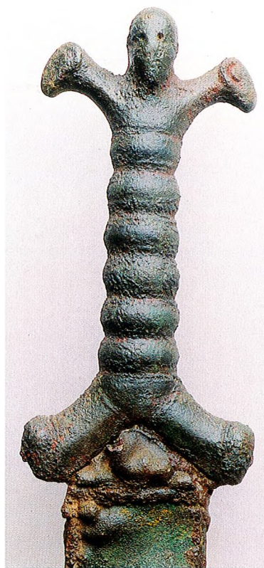
4 Détail de la poignée anthropomorphe d'une épée issue d'une tombe de Mouriès, I er s. av. J.-C. Musée des Antiquités Nationales.

guerriers de type Grézan et les bustes du type de Sainte-Anastasia sont des représentations peut-être plus anciennes, pourquoi pas des âges du Bronze. Parallèlement, en étudiant l'armement et les codes artistiques des Celtes, André Rapin tend aux mêmes conclusions.