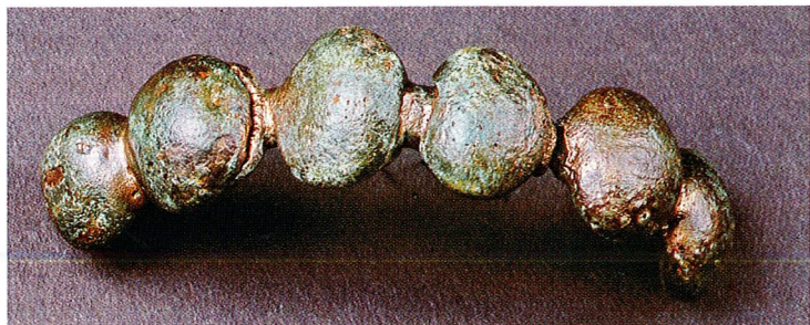
3 Bracelet celtique du second Âge du Fer. Site (tombe ?) du Castellet