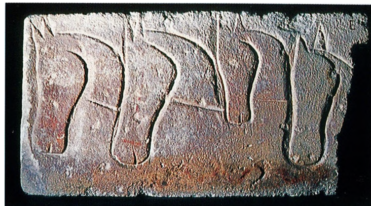
5 Linteau aux chevaux de Roquepertuse à Velaux. Musée de la Vieille Charité (Marseille)

Toujours en restant dans le domaine du symbolique mais en exploitant des moyens graphiques différents, les défilés des quatre cavaliers de Hallstatt comme ceux de Gundestrup procèdent de ce même souci de différenciation : singularité du 3 e cavalier, rapprochement avec le 1 er , différenciation des vêtements, des symboles annexes ou des casques, etc. Il se peut que sous ces représentations figuratives diverses, frustes ou très élaborées se dissimule un même récit allégorique, mythique, fondateur, etc. qui participe d'un fonds commun celtique. En revanche, l'omniprésence du thème du cheval dans l'art lapidaire méridional ne recouvre pas nécessairement partout la même symbolique. Ainsi la frise des trois chevaux gravés et peints sous le buste casqué de Sainte-Anastase ne comprend en réalité que deux chevaux. Le premier animal peint en rouge y compris au-dessus de l'échine arquée et convexe, soit à l'opposé du dessin des chevaux, relève d'une autre identité. Son encolure courte trapue, le dos bombé et l'éventuelle crête dorsale seraient plutôt à associer au sanglier en général. Autre symbole, autre thème... S'il reste possible d'améliorer la lecture de ces images par les regards