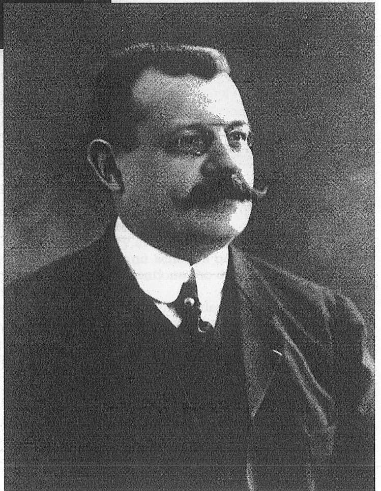
2. J. Déchelette.