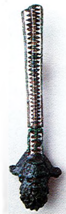
Bibracte, anse d'une cruche campanienne ; bronze rehaussé d'argent.