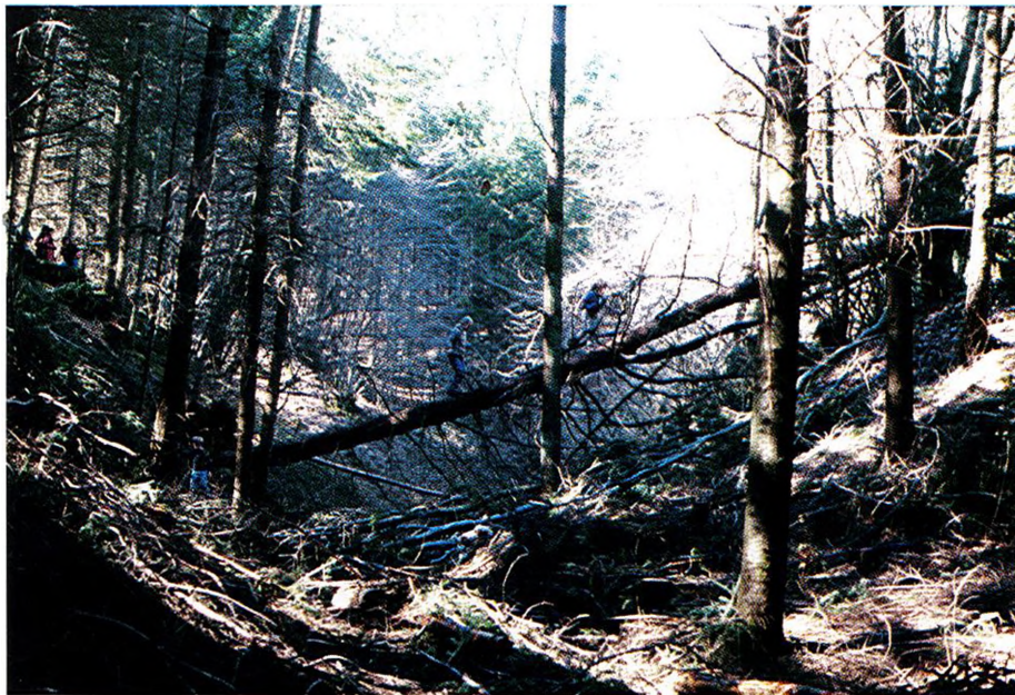
Arleuf, restes d'une exploitation du quartz aurifère (photo G. Ruet).