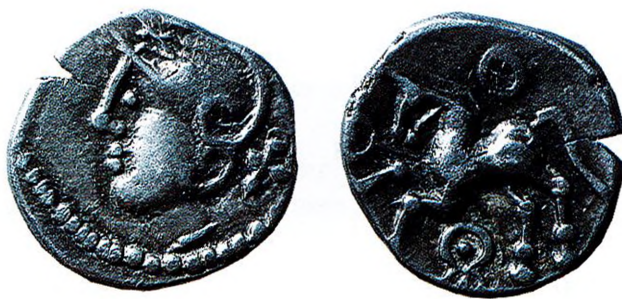
Bibracte, denier d'argent éduen : tête casquée à gauche, cheval à gauche. Ces monnaies anépigraphes à tête casquée sont très nombreuses dans les fouilles anciennes de Bibracte, qui ont livré un coin correspondant à ce type.