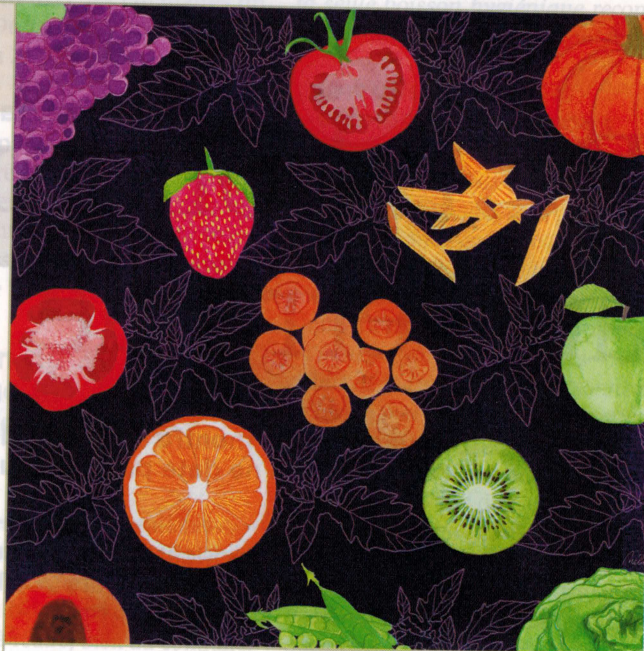
Illustration de couverture: Mélie Jouassin Illustrations intérieures: Dominique Mutio

42 Les bénéfiques du self collaboratif FRANÇOISE MOREDA