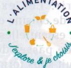
Historique du projet.