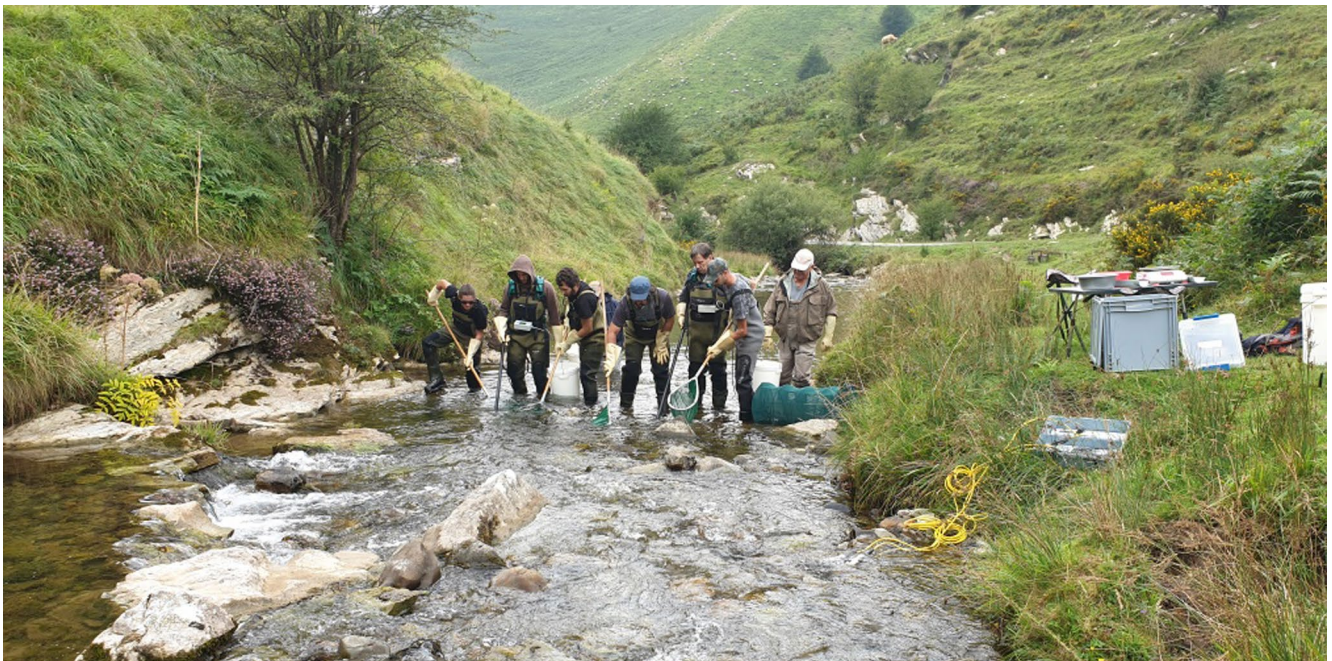
FIG. 2. — Pêche électrique réalisée sur l'Egurguy au lieu-dit de Nekez Egina (commune de Lecumberry), 43°1'32"N-1°8'31.6"O, le 27 août 2019.