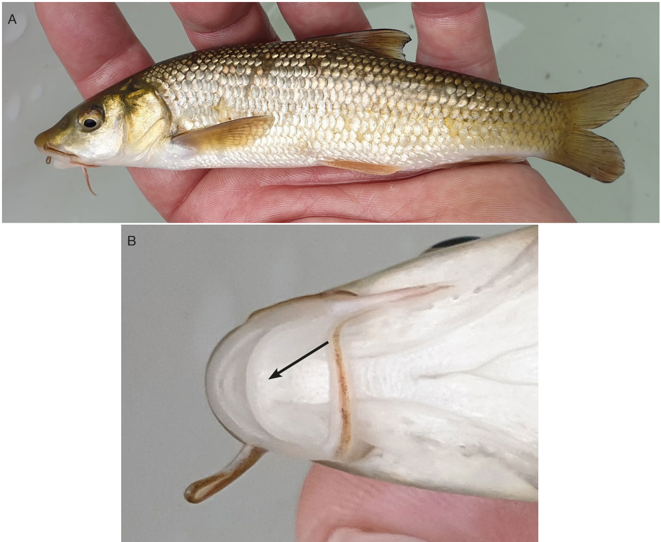
FIG. 3. — Barbeau de Graells Luciobarbus graellsii (Steindachner, 1866), 161 mm en longueur totale pour 53 g, capturé dans l'Egurguy : en vue latérale (A) et la tête en vue ventrale (B) montrant l'absence de lobe sur la lèvre inférieure (flèche).