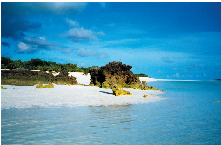
Littoral nord, Grande-Glorieuse. Northern littoral, Grande-Glorieuse.