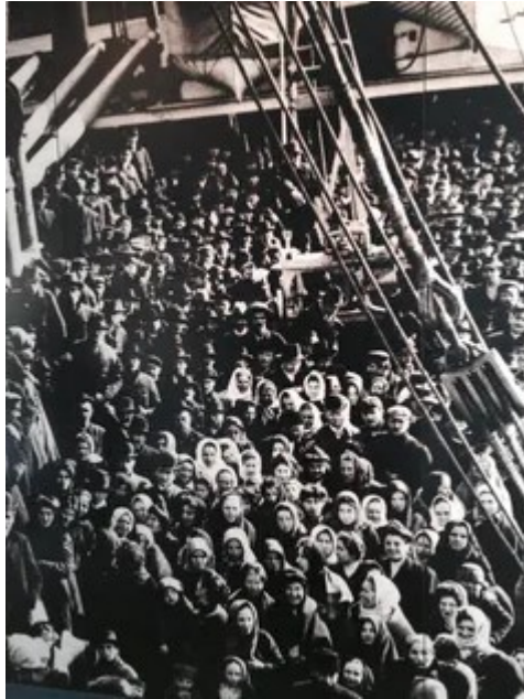
Vue sur un bateau de migrants arrivant à Ellis Island.

commencé par laisser débarquer seulement 5 000 étrangers. Mais la gestion fut si efficace qu'à la fin de la journée, 5 800 avaient pu être enregistrés. Les 7 000 migrants restants devaient attendre le lendemain sur le bateau. L'attente n'était pas facile après une à deux semaines de voyage en bateau.