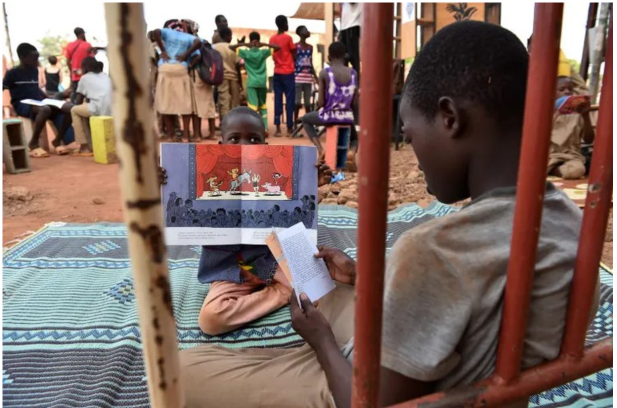
À Ouagadougou, capitale du Burkina Faso, en octobre 2018.

Ces comparaisons tiennent compte des prix dans chaque pays, comme l'indique l'expression « parité de pouvoir d'achat ». Si le pouvoir d'achat des gilets jaunes justifie la colère, comment appeler le sentiment qu'étouffent les Burkinabés ?