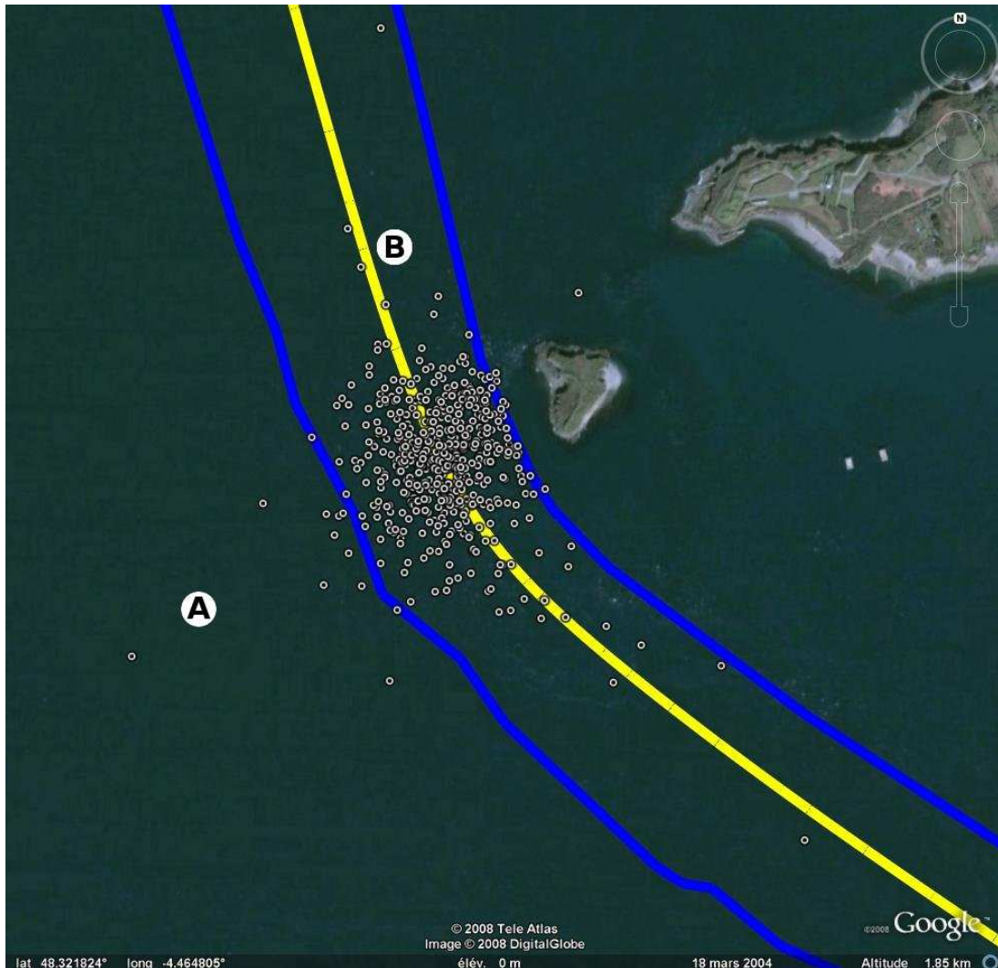
Figure 3 Nuage de points des positions des navires après avoir quitté le port depuis 10 minutes