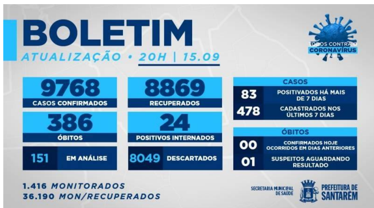
Figure 3. Bulletin épidémiologique de Santarém.

Ainsi, le 31 juillet 2020, l'État du Pará, Belém et Santarém n'intégraient aucune information sociologique, raciale ou ethnique dans les bulletins publiés.