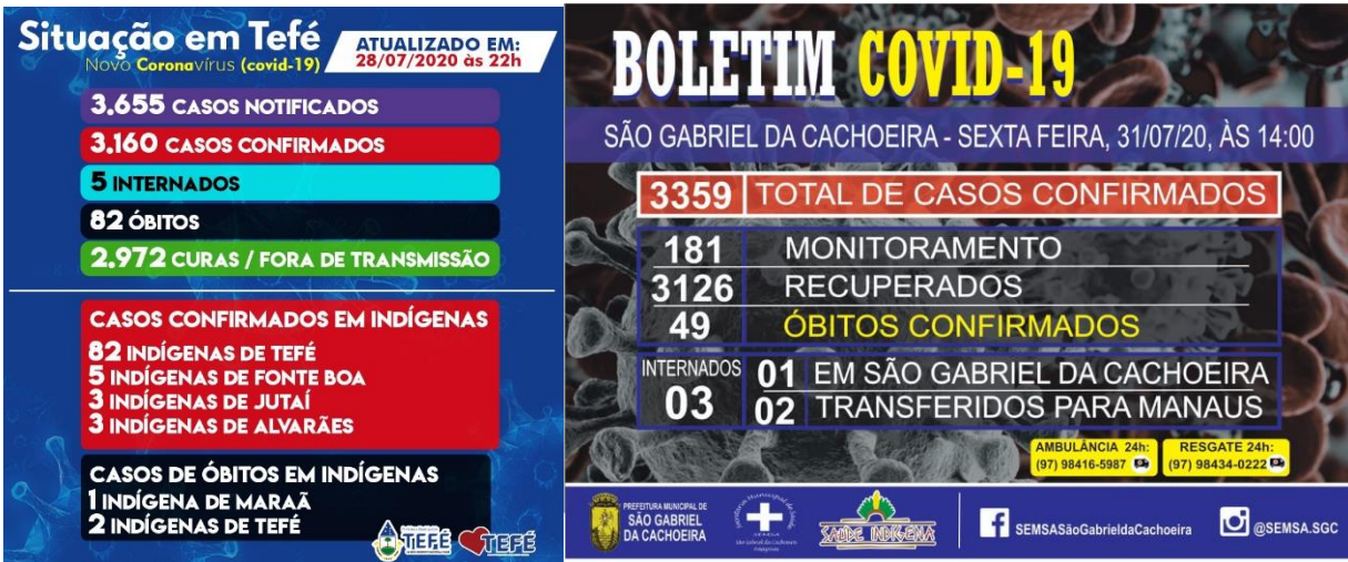
Figure 2. Bulletins épidémiologiques de communes de l’Amazonas.