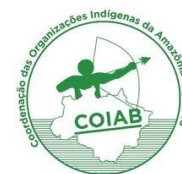
Figure 4 : Bulletin épidémiologique des Indígenas d'Amazonie.