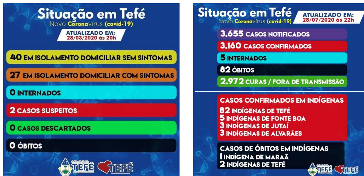
Figure 6 : Changement de présentation du bulletin épidémiologique de Tefé.

À Tefé, les bulletins épidémiologiques de la commune ont donné des informations ethniques à partir du mois de juin 2020, suite à une demande du Conseil Indigéniste Missionnaire (CIMI) et de l' Associação das Mulheres Indígenas do Médio Solimões e Afluentes (Association des Femmes Indigènes du Moyen Solimões et affluents) (AMIMSA), tous deux représentés dans le Comité de Crise de Lutte contre la Covid-19. Dès lors, les nouveaux cas et les décès recensés chez les Indígenas par le CIMI et l'AMIMSA sont comptabilisés. À Tefé donc, ce sont plutôt les populations autochtones urbaines qui apparaissent sur le bulletin. Celles qui vivent dans les Terras Indígenas sont pour leur part dénombrées par le DSEI du moyen Solimões et notifiées sur le bulletin de la FVS/AM. Au 4 août 2020, Tefé annonçait 99 cas confirmés et 3 décès de personnes Indígenas (citadines). Le DSEI indiquait 220 cas confirmés et 8 décès d' Indígenas vivant dans les Terras Indígenas du moyen Solimões. Tefé a ainsi transformé son bulletin pour rendre visible ses populations autochtones urbaines (Figure 6).