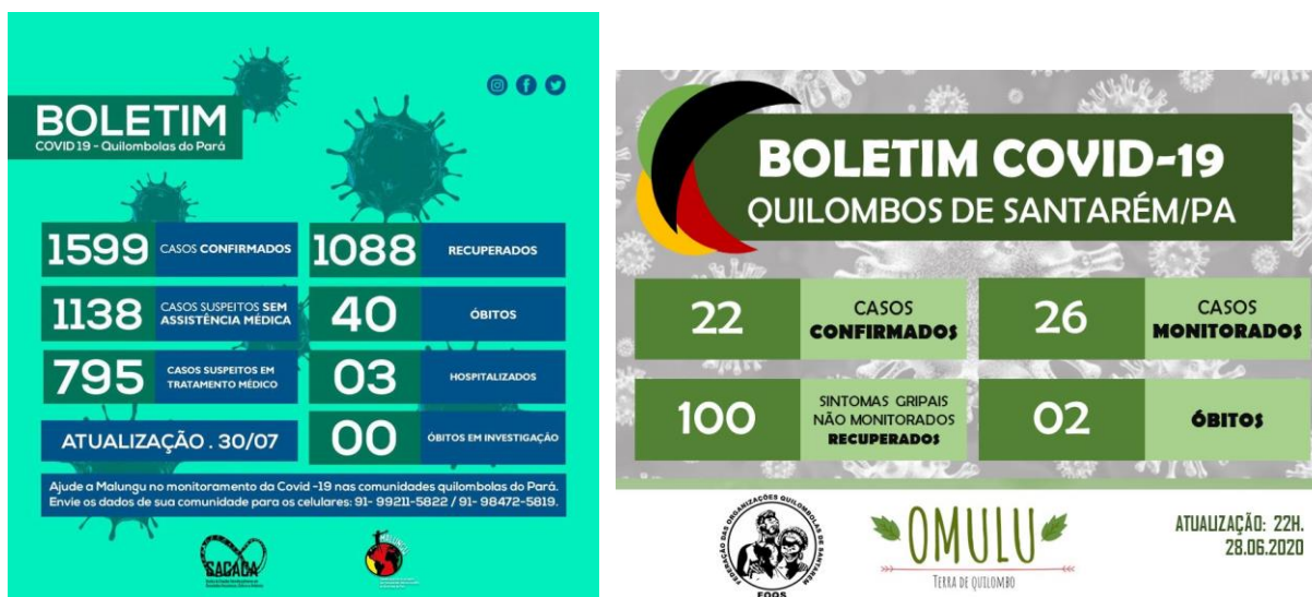
Figure 5 : Bulletin épidémiologique des quilombolas du Pará et de Santarém.

Les organisations quilombolas , moins bien structurées, se sont mobilisée plus tardivement et avec moins d'engouement. En partenariat avec l' Instituto Socioambiental , la Coordenação Nacional de Articulação das Comunidades Negras Rurais Quilombolas (Coordination Nationale d'Articulation des Communautés Noires Rurales Quilombolas) (CONAQ) a créé l'observatoire Quilombo sem COVID-19 . Cet observatoire national compile les informations produites par les secrétariats de Santé des États. Des initiatives locales ont aussi parfois permis une remontée des informations : dans le Pará, la Coordenação das Associações das Comunidades Remanescentes de Quilombos do Pará (Coordination des Associations Quilombolas de l'État du Pará) (Malungu) et l'Université fédérale de l'Ouest du Pará centralisent les informations et produisent régulièrement un bulletin épidémiologique publié sur une page Facebook. À Santarém, la Federação das Organizações Quilombolas de Santarém (Fédération des Organisations Quilombolas de Santarém) (FOQS) a créé l'observatoire Omulu – Terra de Quilombo 23 qui a réalisé, à partir de juin 2020, le suivi épidémiologique des habitants des neufs villages quilombolas de la commune (Figure 5). Ces actions, menée dans le Pará grâce à l'appui d'une université, sont des exceptions en Amazonie où les Quilombolas ont été peu visibles et systématiquement absents des bulletins épidémiologiques officiels.