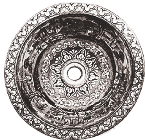
Fig. 32. Lavabo de porcelaine anglaise à forme et décors identiques aux tessons prélevés

En recherchant la quille nous avons mis au jour, assez profondément enfoui, un lot de matériel que nous avons attribué à l'équipement du bord, poulie et cap de mouton sans estrope, réas neufs de toutes tailles et fragments de verre non alimentaires qui nous amènent à l'hypothèse d'un stock de matériel de rechange.