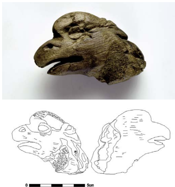
Fig. 30. Tête d'aigle en bois après restauration (dessin M. Jaouen/Drassm)

♦ Le Kléber (EA 847). Site non déclaré, donc pas expertisé jusqu'alors, le Kléber était un paquebot de 98 m de long en acier puddlé lancé en 1880 par les chantiers Caird & Co. Son port en lourd était de 860 tonnes. On connaît onze sister-ships à ce bâtiment qui participa, entre autre, à l'expédition de Tunisie