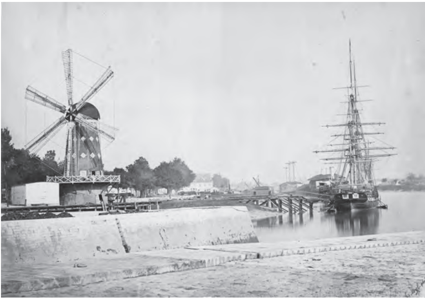
Fig. 3. – Photographie du moulin en novembre 1866