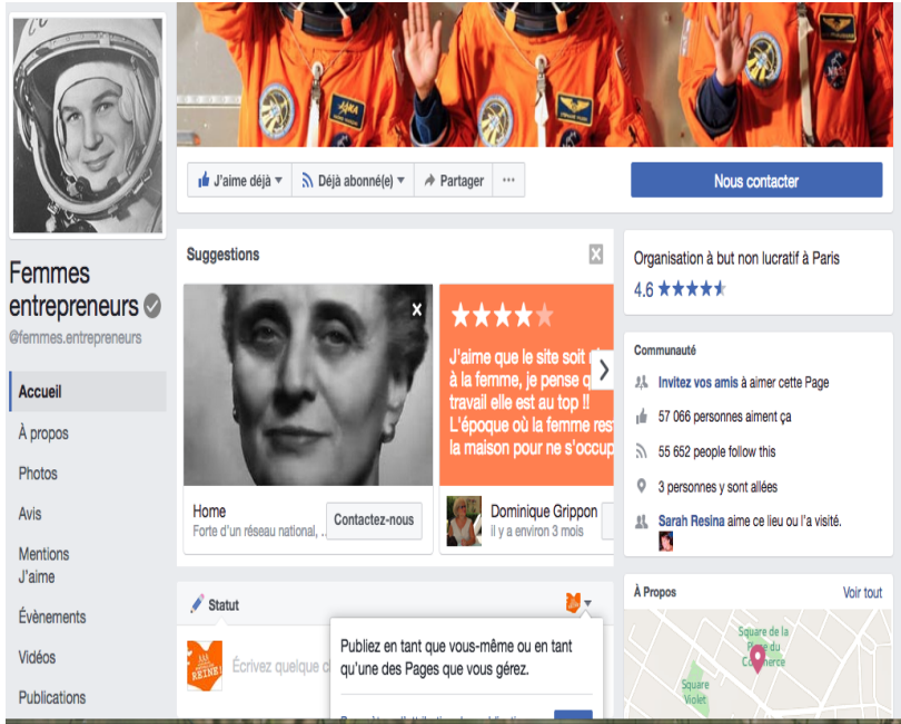
Figure 4. Page facebook Entrepreneur d'avenir