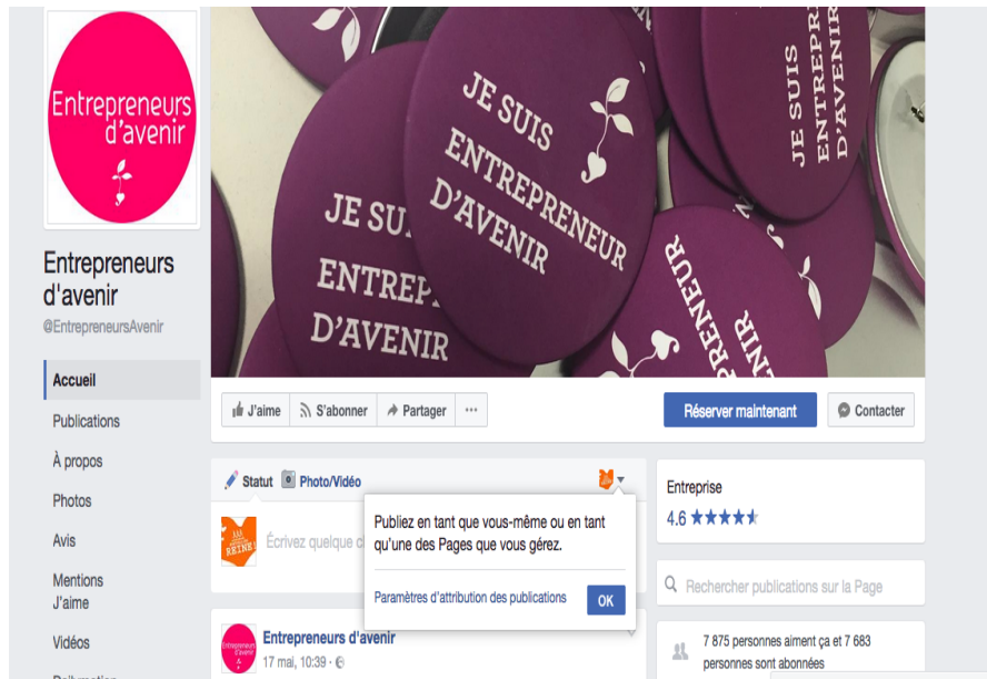
Figure 5. Thématiques traitées sur les deux réseaux