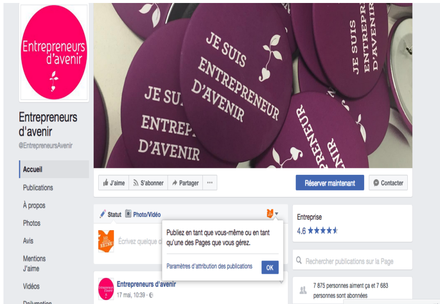
Figure 5. Thématiques traitées sur les deux réseaux