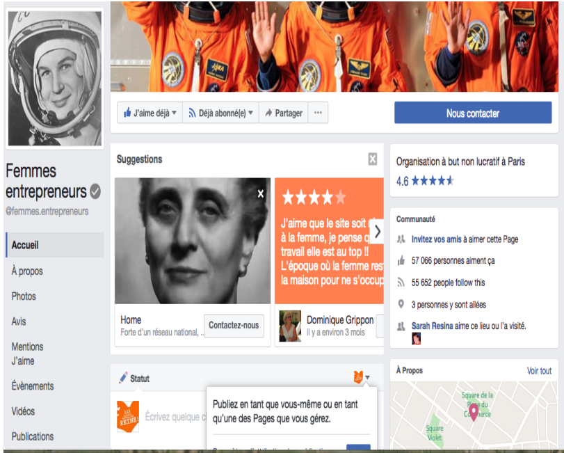
Figure 4. Page facebook Entrepreneur d'avenir