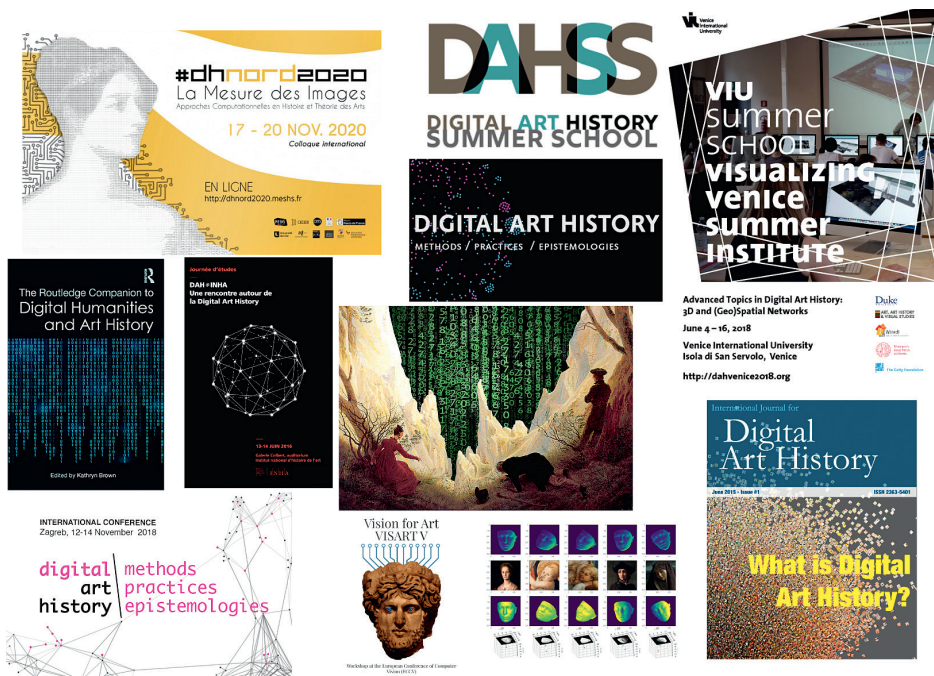
Fig. 2. Visuels de colloques, ouvrages et séminaires consacrés aux humanités numériques en histoire de l'art.