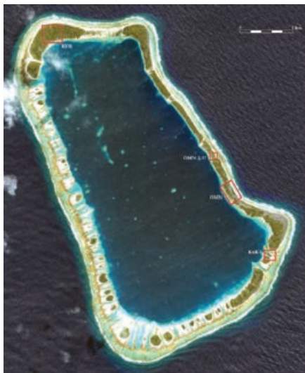
Fig. 1 ◀ L'atoll de Temoe et les zones étudiées lors des missions 2010 et 2013.

En raison de la richesse de l'atoll, l'un des objectifs initiaux du projet consistait en la cartographie des ensembles de monuments de surface et en leur description et relevés en plan détaillés. Nos prospections intensives ont permis de mettre en évidence des zones de concentration de structures tout autour de l'île qui furent définies selon les normes d'identification de la DCP, d'après les noms des motu et des terres. Les découvertes initiales reposaient prioritairement sur la connaissance de nos accompagnateurs mangarévien. Par la suite, un plan de prospection systématique a été suivi permettant de couvrir toute la surface de l'atoll depuis le large jusqu'au bord intérieur du lagon. Chaque structure découverte a été enregistrée en la géolocalisant, et en la décrivant en détails à l'aide de relevés planimétriques et photographiques. Ces informations sont intégrées à