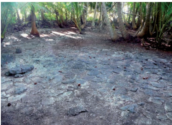
►Fig. 3 ◀ Vue de l'espace pavé sur la maison KUR-18 avec l'une des tables de pierre.

Afin de mieux comprendre la fonction de ces maisons et de replacer leur usage dans la séquence de l'atoll, nous avons ouvert plusieurs sondages. Sur KUR-18, nous avons fouillé un espace associé à l'unique dalle de chant du pavage. Il s'est avéré être un compartiment de 52 x 36 cm aménagé dans la