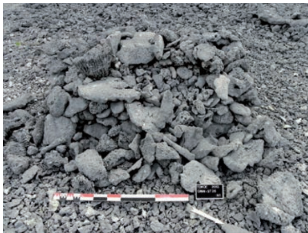
► Fig. 6 ◀ Vue de la structure OMN-2-37.

La question se pose de la contemporanéité de ces sépultures et, conjointement, celle de l'élaboration du monument lui-même. Certaines de nos observations sont en faveur d'aménagements échelonnés dans le temps, où KUR-03A serait la première sépulture mise en place. Cette hypothèse semble confirmée par les datations réalisées sur trois des squelettes qui placent 03A aux environs de 437 BP, et 03E et 03F vers 335 BP (tab. 1). L'association spatiale de ces individus au sein d'une seule et même structure peut aussi suggérer une association généalogique que seules des études ADN pourraient documenter.