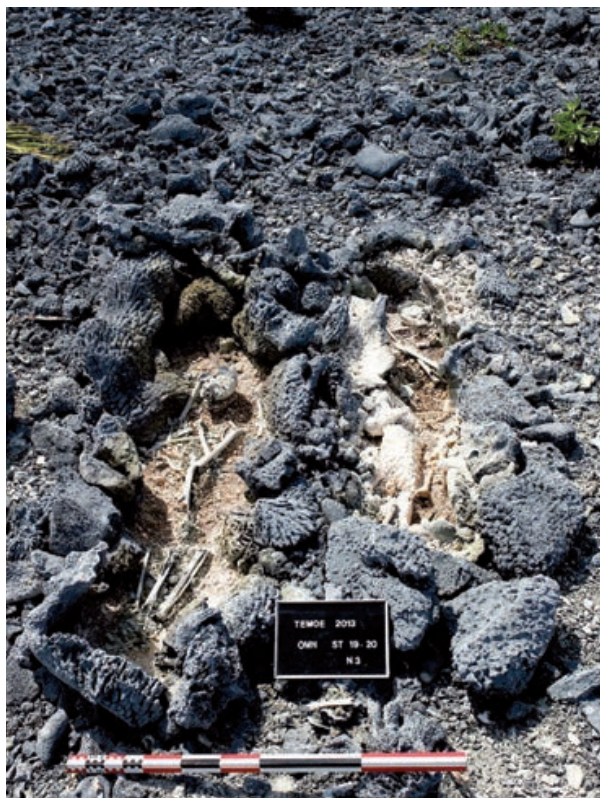
► Fig. 5 ◀ Structures OMN-2-19 et OMN-2-20 en cours de fouille.

Cinq aménagements sépulcraux ont été identifiés dans la construction, par la présence soit de pierres de chant, soit de dalles de couverture qui délimitent des coffrages. Ces derniers abritaient des sépultures primaires individuelles dont le dépôt est organisé selon une position initiale identique : décubitus dorsal, la tête à l'ouest ou au nord-ouest, membres supérieurs et inférieurs en extension, et les mains au niveau du bassin. Les coffres ont été aménagés suite au dépôt et adaptés au volume du corps. La décomposition s'est ainsi opérée en espace libre. Sur les cinq individus, quatre sont adultes et de sexe masculin. Le cinquième (KUR-03E) est un pré-adolescent âgé entre 12 et 15 ans. A l'exception de ce dernier, les sépultures ont fait l'objet de ré-intervention humaine après décomposition, la plus manifeste étant le prélèvement du bloc crânio-facial. On note aussi des actes de réduction à l'instar de KUR-03A où les os de grande taille ont été rassemblés, de manière organisée et en faisceaux, au niveau du thorax.