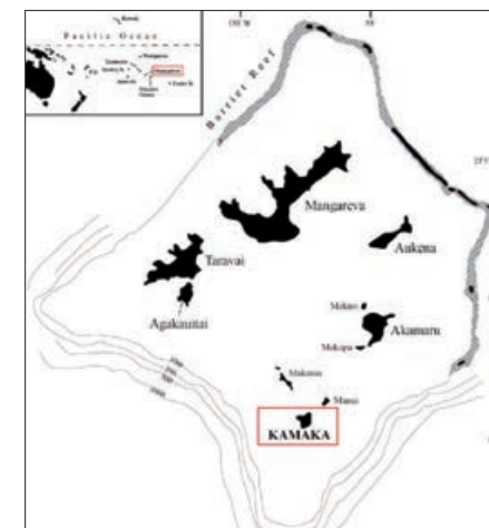
► Fig. 1 ◀ Carte de l'archipel des Gambier et localisation de l'île de Kamaka.

Dans le cadre d'un programme de recherches intensives dans l'archipel des Gambier (fig. 1), Roger C. Green conduisit la fouille du principal abri-sous-roche de l'île de Kamaka auquel il donna le nom de Kitchen Cave (son numéro d'inventaire original était GK-1, plus tard modifié en 190-04-KAM-1 selon les normes de la Direction de la Culture et du Patrimoine). Ce grand abri est situé dans la partie nord et protégée de Kamaka, au lieu-dit Sancho's Cove. Les fouilles de Green révélèrent une stratigraphie complexe et relativement longue, ainsi qu'un important assemblage d'artefacts et de restes de faune. Malheureusement, ces résultats restèrent longtemps inédits, seules quelques données ayant été partiellement publiées par Green et Weisler (Green et Weisler 2000, 2002, 2004 ; Weisler et Green 2013). Les datations radiocarbone obtenues indiquaient pourtant une occupation initiale de l'abri aux environs de 1200 A.D. (Green et Weisler 2000 : table 2, fig. 24), en faisant un site d'importance pour l'histoire des îles Gambier. Par ailleurs, une partie du sol de l'abri était demeurée exempte de perturbation. Pour ces raisons, il nous semblait opportun de reprendre la fouille de ces dépôts et de les analyser selon des techniques non disponibles