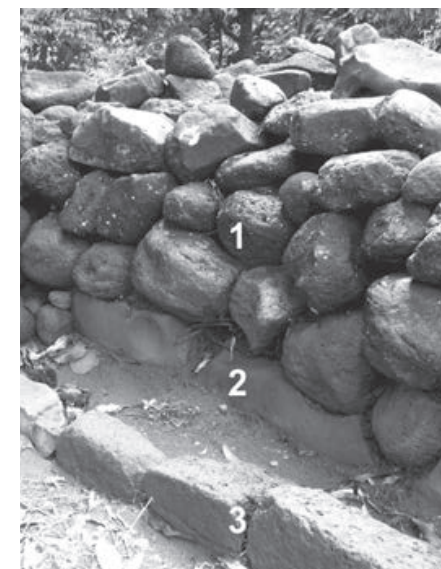
► Fig. 3 ◀ Détail du bord ouest de la structure PER-1, après décapage : premier parement marqué par un appareil irrégulier (1), assise du premier parement (2), assise conservée du deuxième parement marqué par un appareil plat plus régulier (3).

Bien que la restauration des deux structures archéologiques soit encore en cours, l'association Puna Reo a déjà démarré ses actions culturelles autour du site. Plusieurs fare pote'e , un petit fa'a'apu (bananiers, tubercules, etc.) et un ahima'a ont également été implantés en contre-bas du promontoire où se trouvent les structures archéologiques. La mise en place de ces différents projets a donné lieu à la formation de plusieurs jeunes de Piha'e'ina, et l'association fait d'ores et déjà vivre le site avec l'accueil de quelques groupes d'enfants et du public souhaitant y organiser des formations ou des événements culturels.