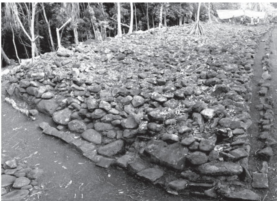
► Fig. 2 ◀ Plateforme PER-1 en cours de décapage vue depuis le Nord. A noter : les deux lignes d'assises préservées.

Il conviendra de démonter une partie de ces fosses pour bien comprendre leur morphologie, car elles sont actuellement obstruées par l'effondrement du pavage. La dernière phase des travaux menés à Pererau a été consacrée, en 2015, à l'ouverture d'un sondage dans la partie sud du site, la plus perturbée par les activités modernes. La présence de plusieurs dalles de corail à ce niveau laissait envisager la possibilité qu'un ahu ait pu avoir été autrefois érigé avant d'être détruit ou démonté pour réemploi des blocs, comme c'est le cas pour de nombreux sites monumentaux de la région. Une fouille de 10 m 2 a ainsi été ouverte afin de vérifier la présence de structures de fondation ou de vestiges indiquant la démarcation d'un ahu . Seules les dalles de pavage en place ont pu être identifiées sous un niveau récent composé de sédiments organiques et d'humus, et aucun signe de superstructure ou de rupture dans la surface pavée n'est apparue.