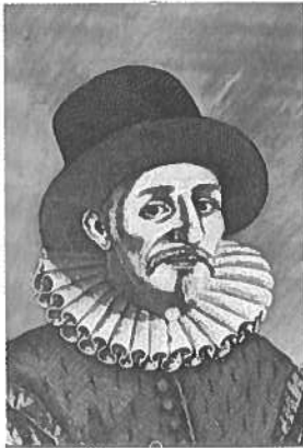
DU BARTAS retouché