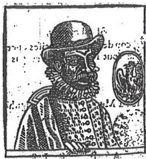
G 1583 B.