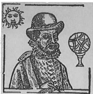
N 16 (Chom. 19)