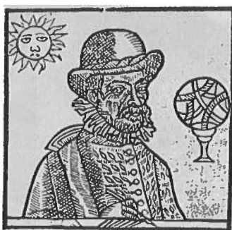
N 2 (Chom. 65)