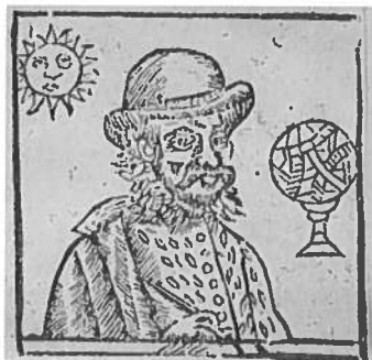
N 23 (Chom. 64)