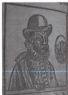
G 1583 O.