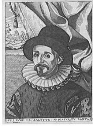
DU BARTAS par Larmessin