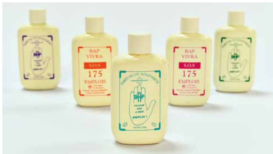
5. Parfums de solidarité , 1996

Les ouvriers de l'usine Bourgogne Application Plastique, en Côte d'Or, vendirent plusieurs milliers de flacons en plastique moulé du « Parfum de solidarité » afin de financer leur grève illimitée avec occupation des locaux. Cet « objet de grève » fut collecté, ainsi que 39 autres, par l'artiste Jean-Luc Moulène.