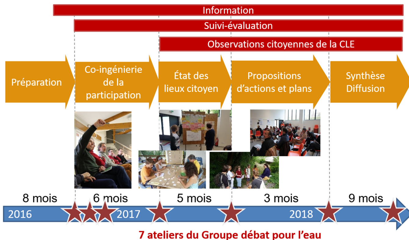
Fig. 2. Les étapes de la démarche participative sur la Drôme (Source : SMRD et Irstea).

La démarche participative a duré presque trois ans et incluait plusieurs étapes (Fig. 2). La préparation de la démarche incluait la constitution et les premières réunions du Groupe Pilote et les réunions d'information du public. L'étape de co-ingénierie de la participation s'est déroulée de décembre 2016 à mai 2017. Elle a été suivie par une troisième étape d'état des lieux citoyen puis par une quatrième étape de propositions d'actions et de plans. Enfin, la dernière étape consistait à produire la synthèse des données, à transmettre les résultats à la CLE et à promouvoir l'expérience. Les étapes 3, 4 et 5 ont été définies au cours de l'étape de co-ingénierie.