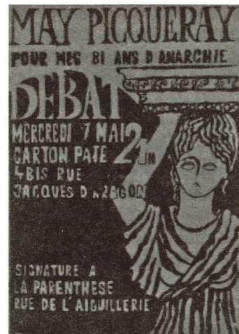
Affiche May Picqueray

Manifesto per la presentazione del libro di May Picqueray il 7 maggio 1980 36 .