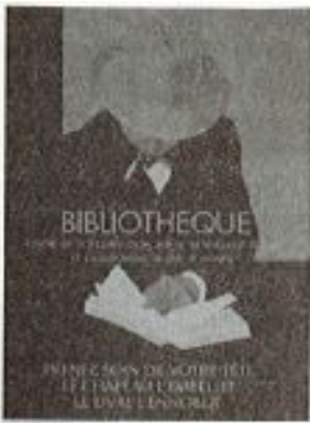
Affiche della Bibliothèque

tuazione del numero dei soci, ai problemi finanziari, agli eventi imponderabili dei rapporti umani, anche in ambiente anarchico (allontanamento, disimpegno dei membri, problemi relazionali), ecc.