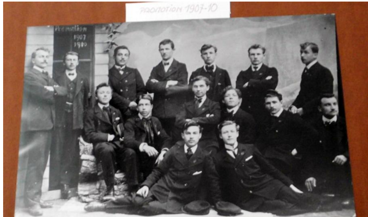
Les noms des personnages que l'on peut lire sous la photo originale ont été masqués ici.