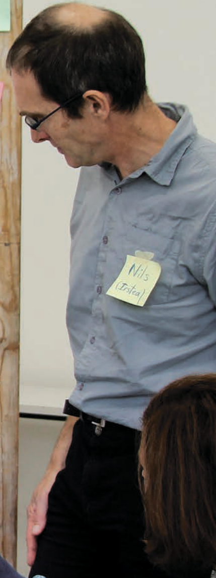
Un atelier participatif pour récolter les avis et les propositions d'actions des citoyens et des habitants dans le cadre de la révision du schéma d'aménagement et de gestion des eaux de la rivière Drôme.