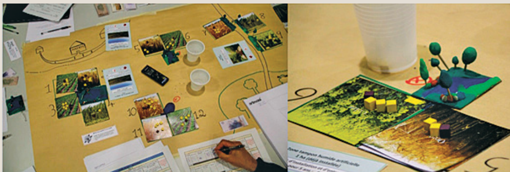
1 Jeu de rôle « Rés'eaulution Diffuse » (projet Brie'Eau).

Le projet de recherche Brie'eau visait à expérimenter une démarche participative pour faciliter le dialogue sur les pollutions diffuses d'origine agricole dans la Brie (Seine-et-Marne). Agriculteurs et acteurs des filières agricoles, élus locaux, acteurs de l'eau potable et associations d'usagers du territoire ont été amenés à co-construire un territoire plus résilient en jouant sur deux leviers d'action : les changements de pratiques agricoles et les aménagements paysagers jouant un rôle de zones tampons en interceptant une partie des polluants entre les parcelles agricoles et les milieux. Un jeu de cartes adapté d'un jeu préexistant, Mete'eau (Barataud et al. , 2015), a d'abord permis de rendre visibles et discutables les perceptions et valeurs de chacun attachées au territoire et à ses enjeux. Ensuite, les visites sur le terrain et les échanges avec les scientifiques ont été propices au partage de savoirs. C'est ensuite un outil de simulation qui a permis de construire une vision commune du territoire et d'imaginer des scénarios agronomiques d'évolution. Enfin, un jeu de rôle construit avec l'aide du bureau d'étude Lisode a constitué un espace virtuel de discussion et de négociation autour d'actions individuelles et collectives (photo 1).