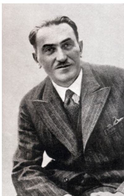
Tadeusz Boy-Żeleński, photo prise avant 1941

Le traducteur le plus connu pour la littérature française fut Tadeusz Boy-Żeleński (1874-1941).