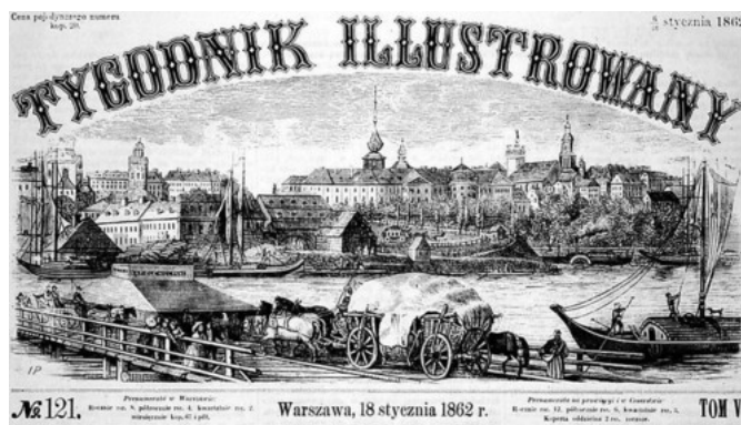
Tygodnik Ilustrowany 1862, la vignette:

A l'instar du modèle français, l'hebdomadaire polonais contenait non seulement les mêmes rubriques, mais on y distinguait aussi des ressemblances au niveau des sujets traités, de la typographie ou bien de la présentation des petites annonces. Egalement, le signe distinctif du journal polonais fut le même que pour la revue française : les gravures sur bois furent d'une excellente qualité [12].