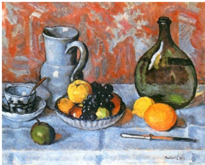
Józef Pankiewicz, Nature morte aux fruits et couteau ( Martwa natura z owocami i nożem ), 1909, huile sur toile, 52 x 65,5 cm, Musée National, Cracovie

http://commons.wikimedia.org/wiki/File:Pankiewicz-Martwa_natura_z_owocami_i_no%C5%BCem_1909.jpg