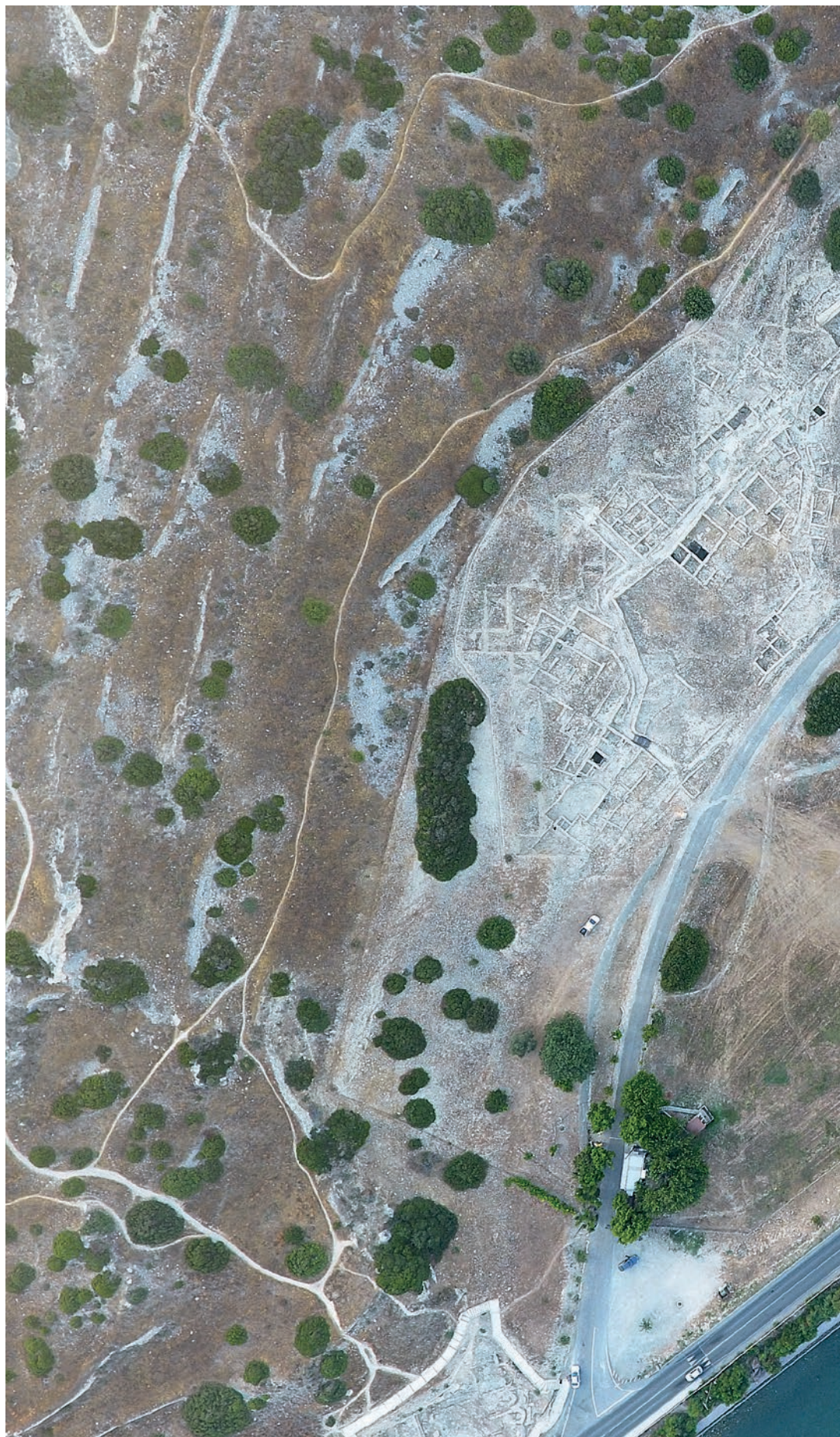
10 Αεροφωτογραφία της Κάτω Πόλης της Αμαθούντας, 2017.