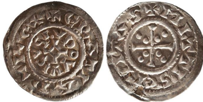
[Fig. 2 – Royaume de Lotharingie, Louis le Germanique (870-876), denier de Metz, Inv. 2014.0.2030. ]