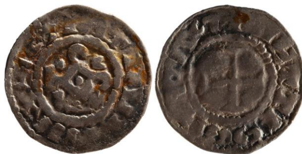
[Fig. 3 – Evêché de Metz, obole de Metz, Inv. 2014.0.2029. ]