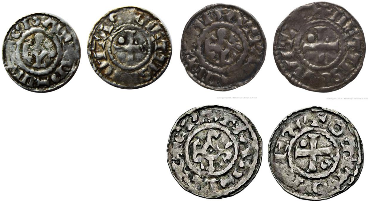
Fig. 4 – Deniers de Metz au monogramme carolin : coin OTTO REX (Coll. Teitgen, n° 738) regravé sur METTIS CIVITAS (BnF, Prou 132)

de CIVITAS est encore bien tracé dans le prolongement du R de REX etc. D'autres exemplaires, tels que celui de la collection Jobal, paraissent être issu d'un autre coin regravé 20 .