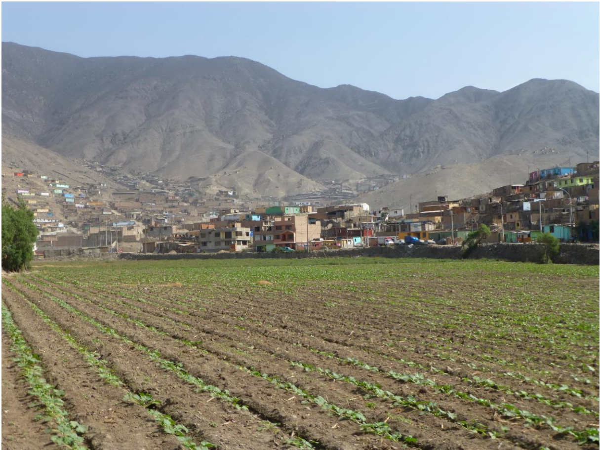
Figure 3 : Urbanisation des flancs de colline

Cliché d'un terrain situé au Nord de la ville, où l'on devine que les espaces agricoles ont été épargné par l'urbanisation, alors que les flancs des collines avoisinantes ont quant à elles été investies par les installations urbaines. Les terrains agricoles ne sont pas systématiquement les premiers touchés par l'urbanisation.