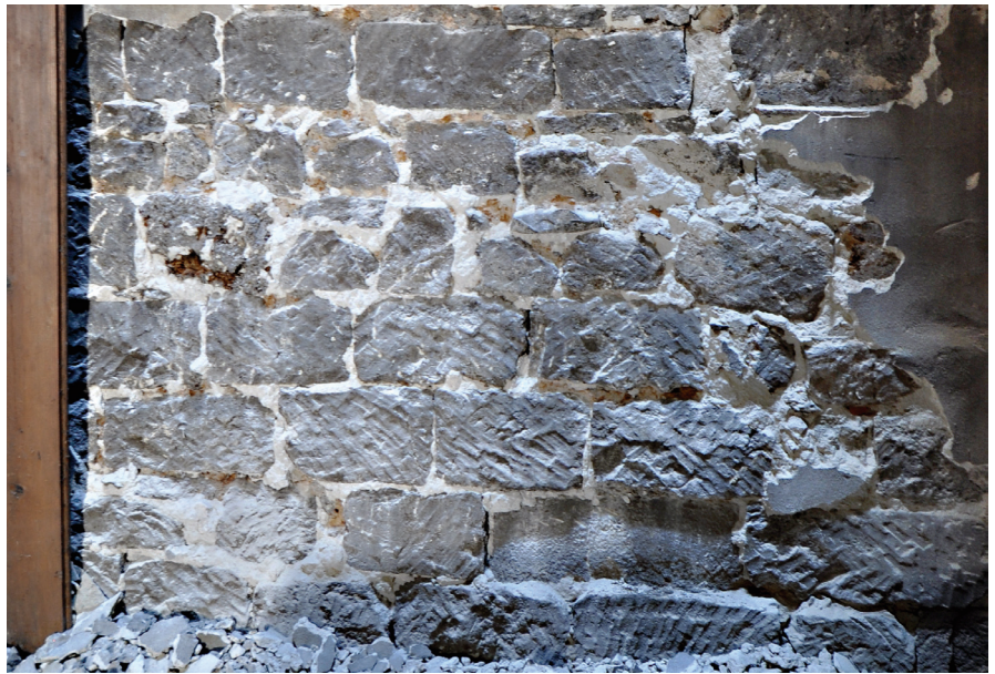
Fig. 7 Traces d'un marteau taillant sur le mur arrière (deuxième étage)

à laquelle on attribue aussi la façade. La maçonnerie de moellons et de blocs équarris de molasse comportant de nombreux fragments de terre cuite, visible au premier étage, s'accorde avec cette hypothèse sans toutefois exclure une reconstruction ultérieure. La séparation totale entre les deux habitations semble cependant intervenir dans un second temps, puisqu'une ouverture est visible dans la petite pièce sud-ouest du premier étage. Seul le piédroit chanfreiné gauche et une partie du linteau en molasse de ce qui semble être une porte permettant l'accès au n° 37 (voir fig. 3) ont été dégagés. La hauteur sous le linteau depuis le plancher actuel est de 1,6 m, ce qui suggère que les niveaux de planchers ont été surélevés depuis le bouchage de la porte. La présence d'un empochement dans le mur du fond, au-dessous des poutres du XIX e siècle, peut également le laisser supposer. L'ouverture dans le mur mitoyen soulève l'hypothèse d'une communication existante entre les deux