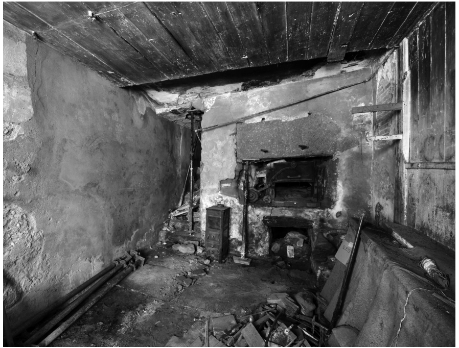
Fig. 4 La pièce avec le four

sur la face supérieure de la banquette, afin d'éviter le tassement du sédiment provoqué par la circulation. Vers la porte enfin, une petite fosse, située au niveau de la rigole mais postérieure à cette dernière, a été mise en évidence; sa fonction n'est pas connue. Ces structures, difficiles à interpréter mais présentant un intérêt quant au mode de construction des murs, correspondent à un premier état de la maison, voire à une phase antérieure à sa construction: la chrono-