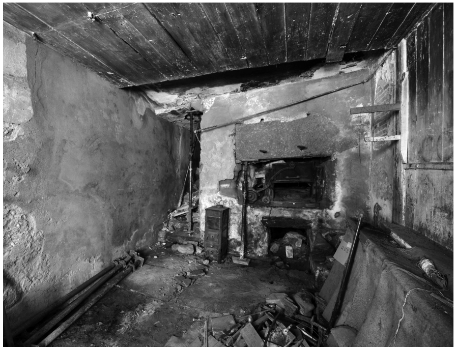
Fig. 4 La pièce avec le four

sur la face supérieure de la banquette, afin d'éviter le tassement du sédiment provoqué par la circulation. Vers la porte enfin, une petite fosse, située au niveau de la rigole mais postérieure à cette dernière, a été mise en évidence; sa fonction n'est pas connue. Ces structures, difficiles à interpréter mais présentant un intérêt quant au mode de construction des murs, correspondent à un premier état de la maison, voire à une phase antérieure à sa construction: la chrono-