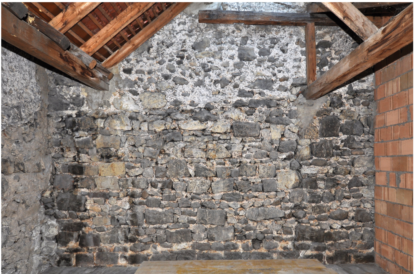
Fig. 8 Mur arrière (comble) avec traces encore visible d'une ancienne toiture

éléments dominants de l'édifice actuel. Les aménagements internes comme les cloisons en pans de bois, une partie de la poutre de la cuisine (premier étage) et la charpente sont datés entre 1832 et 1834. A l'occasion de la construction de la charpente à la Mansart, plusieurs niveaux