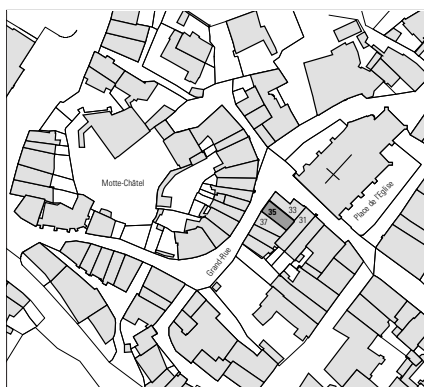
Fig. 2 Localisation de la Grand Rue 35 sur le plan parcellaire

La maison s'organise comme suit: le four au rez-de-chaussée, la cuisine au premier étage, les pièces d'habitation au deuxième et enfin les combles non habités couverts par une charpente à la Mansart. Une trémie ouverte contre le mur du fond sur chaque étage, aménagée au XIX e siècle, permet le passage de la lumière jusqu'au premier. Le bâtiment donne directement sur la rue et ne dispose ni de cour ni de jardin. Il n'est pas possible de restituer l'organisation ancienne de la maison dont il ne subsiste essentiellement que la répartition du XIX e siècle. Deux poutres du plafond de la cuisine au premier étage ont pu être attribuées grâce à la dendrochronologie à la fin du