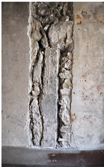
Fig. 3 Piédroit et départ de linteau dégagés dans le mur mitoyen avec le n° 37, au premier étage

Si le plan des étages n'est plus lisible, la structuration ancienne de l'espace peut être appréhendée par le nombre important d'ouvertures bouchées qui sont perceptibles dans la maçonnerie. Au rez-de-chaussée, le percement sur le mur arrière vers le n° 31, au fond du couloir