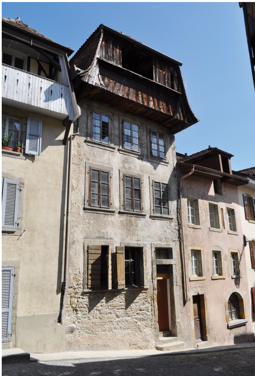
Fig. 1 Façade de la maison de la Grand-Rue 35

L'édifice occupe une parcelle longitudinale perpendiculaire à la Grand-Rue (fig. 2), localisée dans le premier bourg (1220-1230), à proximité immédiate du château le plus ancien d'Estavayer-le-Lac, la Motte-Châtel, et non loin de l'église paroissiale Saint-Laurent. Large de 4,5 m, il atteint 12,5 m de long, mais la pièce du