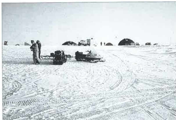
Le dôme principal du camp Grip

océaniques et instabilités des calottes polaires. En outre, chaque interstade important est marqué par une augmentation significative des teneurs en