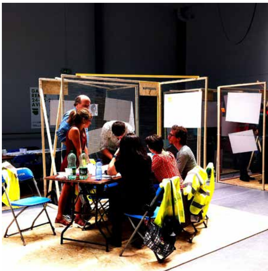
Image 1 – L'équipe des « buffetiers » dans son espace dédié (Lyon, avril 2015).

Dans quel but ces prototypes doivent-ils être produits ? Sur ce point, la commande donnée aux participants n'est pas claire : pendant les discours introductifs à la première journée de l'événement, le directeur de Nova7 invite les participants à « hacker cette gare au sens noble du terme », alors que le représentant de la SNCF – Gares & Connexions précise la commande : « on veut des services innovants pour les clients du train ». Le dispositif participatif s'inscrit ainsi dans un cadre marchand, celui des halls de gare que la SNCF cherche à rendre attractifs. Un échange avec l'élu en charge des mobilités urbaines au