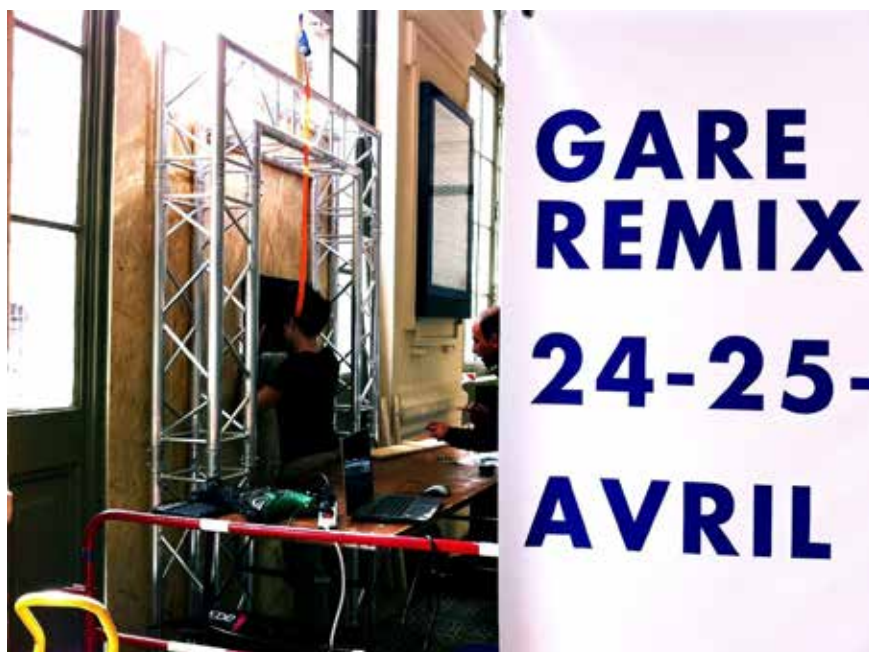
Image 2 – Installation d'un des prototypes avec l'appui et le matériel du living lab Erasme (Lyon, avril 2015).