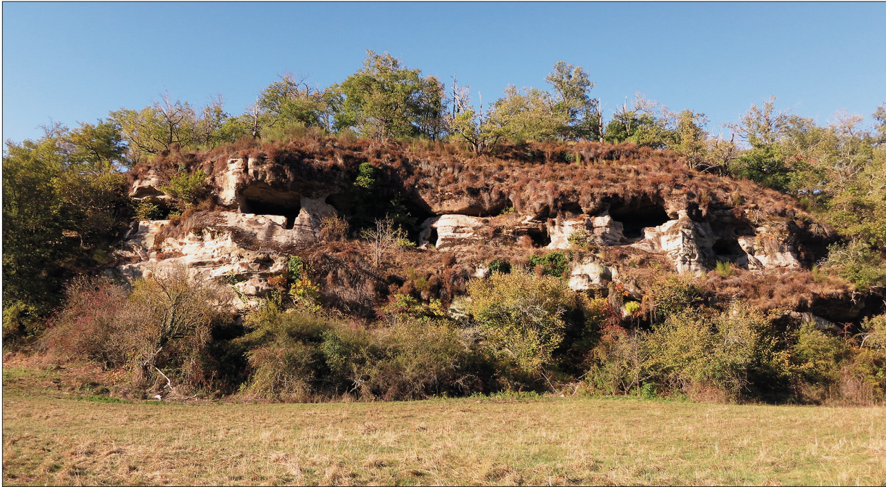
fig. 5: Le site de Siorat (Brive-la-Gaillarde).

par les ouvertures planifiées dès le début du processus de taille. L'hypothèse d'une évacuation de gravats est donc retenue. Les cellules avec UP6 conservées nécessitent un processus de taille différent et peut-être un savoir-faire plus fin. À Mourajoux, Lamouroux, Siorat et Laumont certaines cavités comportent des UP6 conservées ce qui implique donc une autre façon de travailler la roche, plus méticuleuse (fig. 5). De même pour certains éléments à l'intérieur des cavités, l'intervention de professionnels semble requise. Les éléments architecturaux monolithes sont réalisés par des ouvriers spécialisés à partir d'un bloc réservé lors de la taille/creuse de la cellule. La question reste transposable pour le pilier de la salle 51 de Lamouroux ainsi que la question de sa prédétermination ainsi que pour le pilier décoré du site des Roches (Cosnac). Leur réalisation a nécessité de ménager une réserve de roche: est-ce la manifestation d'une volonté de pratiquer un décor ou une nécessité opérée par des questions statiques? Au Roc Negre (Noailles) et site en amont de Lamouroux sur les rives du ruisseau de Combe-Longue, un pilier est également réservé entre les cellules 2 et 3. A Veyssel (Gernes), une ouverture en arc en façade de la cellule (en partie détruite) témoigne de la volonté de réaliser une ouverture régulière avec modénature.