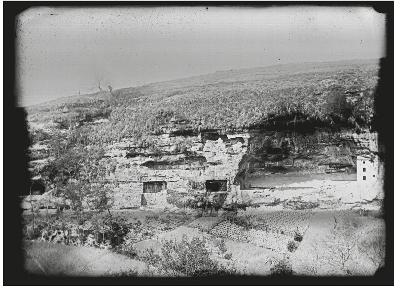
▷ fig. 4: Plaque-photo. Vue d'ensemble du site de Bellet (Brive-la-Gaillarde).

Ils sont implantés non loin des cours d'eau. Tous les ensembles comportent au moins un abri naturel au pied du site, parfois occupé au paléolithique. On peut se demander si la présence des abris naturels a pu peser dans le choix du lieu d'implantation au Moyen Âge, même s'il n'est pas déterminant. Ils pouvaient être, en effet, déjà fréquentés en lien avec des activités agricoles ou saisonnières. Familiers des populations, l'implantation d'un habitat à cet endroit pouvait alors sembler naturelle.