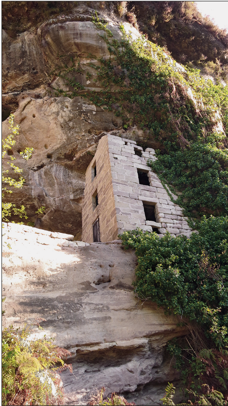
△ fig. 3: Construction située à droite dans le grand abri.