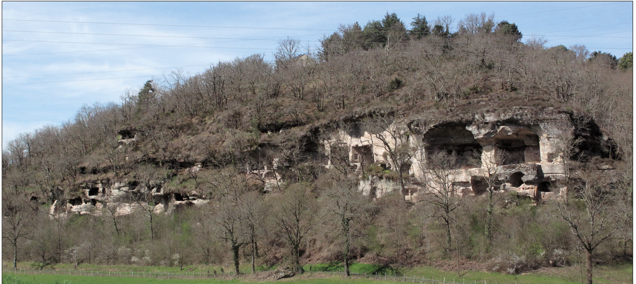
△ fig.2: Photo panoramique du site de Lamouroux (Noailles).