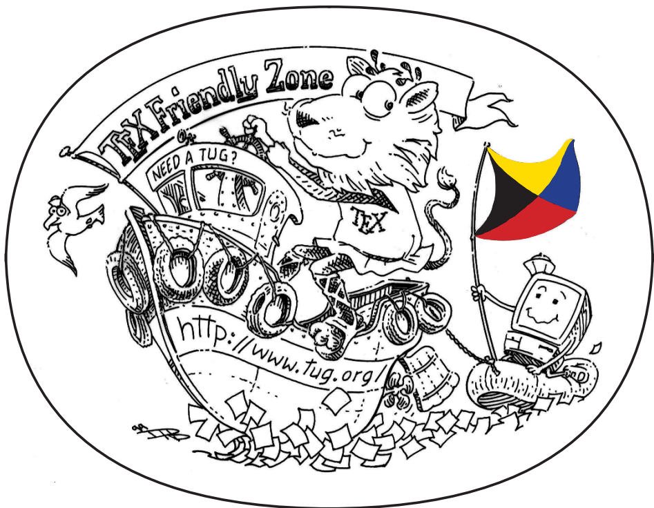
Illustration de Duane BIBBY.

https://www.gutenberg.eu.org/-Adherer-a-l-association,14-