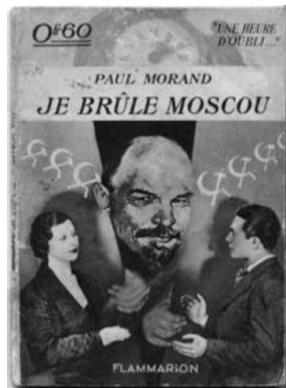
Couverture du livre de Paul Morand, Je brûle Moscou , Paris, Flammarion, collection « Une heure d'oubli... », 1934, 61p., Nouvelle reprise de l'Europe galante, Grasset, 1925.