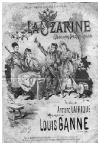
La Czarine : chanson célébrant l'Alliance franco-russe

Что же принесли французской литературе эти многочисленные упражнения «на русскую тему»? Во-первых, помогли выйти из тупика, созданного кризисом романа; способствовали обновлению устаревшего романа «на экзотическую тему» и расцвету публицистической прозы; пробудили интерес к детской литературе и историческому роману; открыли неисчерпаемый кладезь новых тем и размышлений; подарили новых героев и в особенности героинь, о которых можно сказать словами Бальзака о Феодоре в «Шагреновой коже»: «это не женщина — это роман».