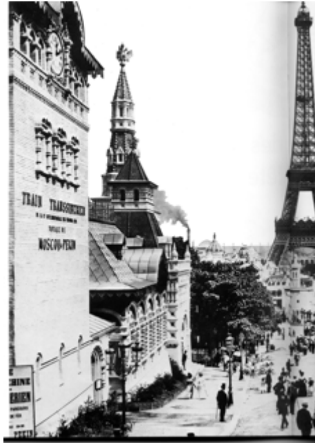
Exposition 1900:Le Transsibérien et la Tour Eiffel