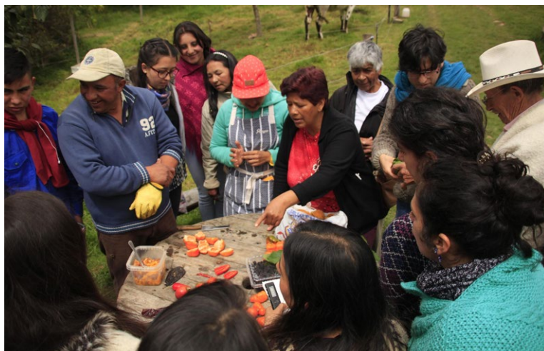
Figura 2. Ajíes sobre la mesa, vereda El Hato, Usme.

Para enfatizar los sentidos de pertenencia y reciprocidad, se coordinó con las comunidades y los investigadores los aportes, de manera que todos fueron anfitriones y comensales a la vez. Ambos encuentros incluyeron recetas diversas, lo que permitió que los participantes escogieran espontáneamente unirse a cualquier preparación. La realización fue precedida por una exposición de ingredientes y un intercambio de conocimientos sobre ellos (Figura 2).