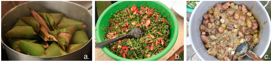
Figura 3. Algunas de las preparaciones realizadas durante los encuentros culinarios: envueltos tres puntas (a), ensalada de hierbas silvestres (b), y cornetos con guiso de maní (c).

disponibilidad de insumos locales, resultando en innovaciones culinarias que fusionan lo local con tendencias provenientes de distintas regiones representadas en los habitantes de la ciudad. Así, las cocinas tradicionales de la ruralidad son una manifestación de la multiculturalidad de Bogotá en sentido amplio.