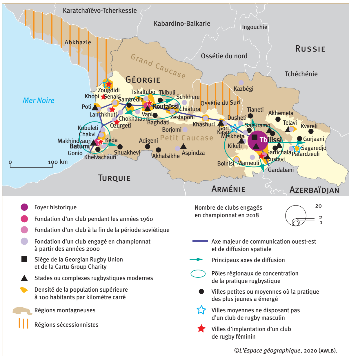
Fig. 2 / La diffusion spatio-temporelle du rugby à XV en Géorgie