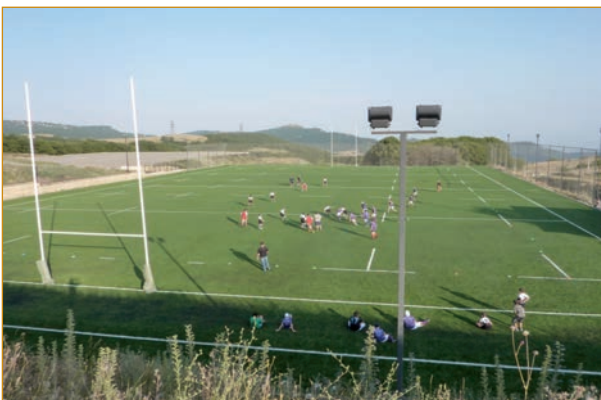
Photo 1/ Le stade du club Junkers RC