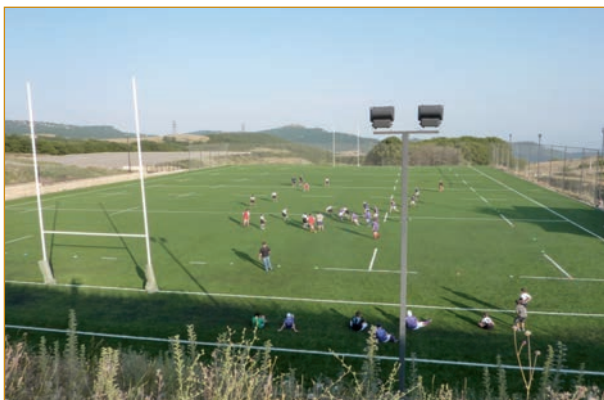
Photo 1/ Le stade du club Junkers RC