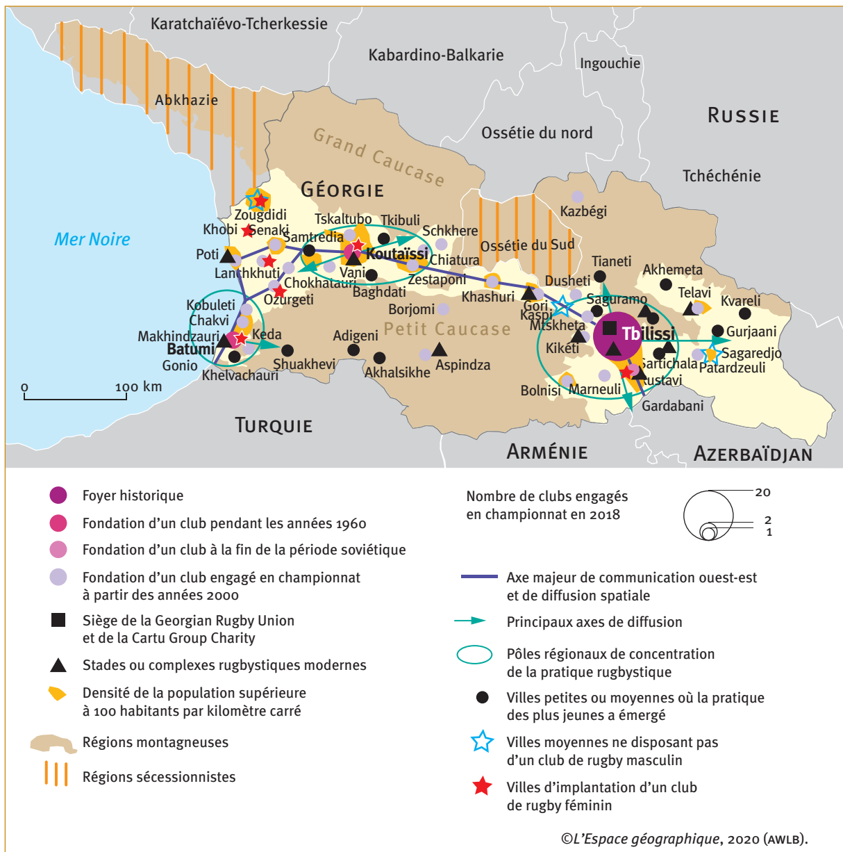
Fig. 2 / La diffusion spatio-temporelle du rugby à XV en Géorgie