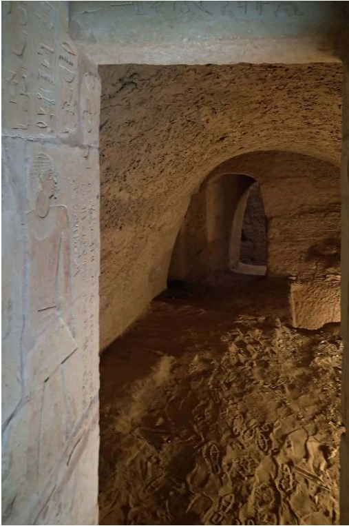
Fig. 4. Complexe funéraire TG 3 : voûte restaurée de la chapelle funéraire T11 (décembre 2019) ; vue de l'est vers l'ouest.