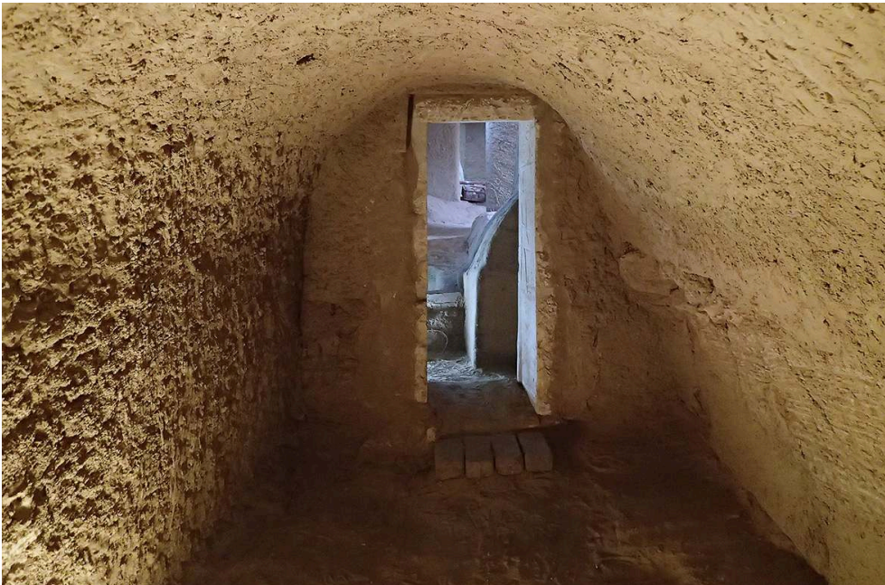
Fig. 5. Complexe funéraire TG 3 : voûte restaurée de la chapelle funéraire T11 (décembre 2019) ; vue de l'ouest vers l'est.