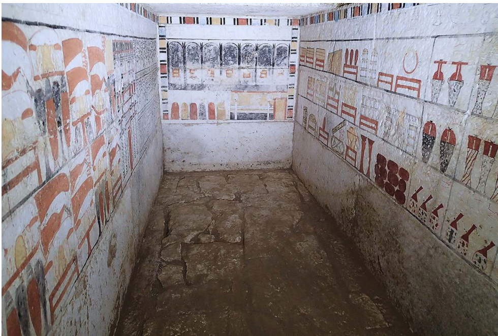
Fig. 1. Structure en brique crue 1164 : chambre funéraire décorée du prêtre ritualiste Sabi ; vue du nord au sud.