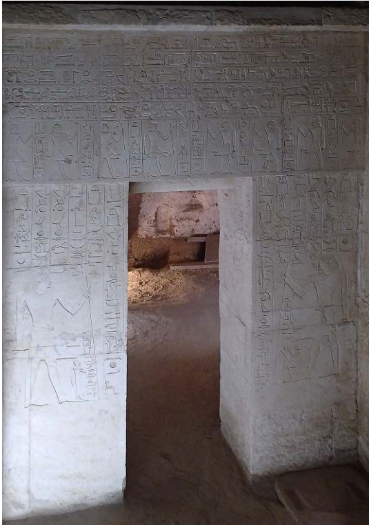
Fig. 6. Complexe funéraire TG 3 : façade décorée de la chapelle funéraire T12 du prêtre ritualiste Ânkh-haef ; vue de l'est vers l'ouest (V. Dobrev).