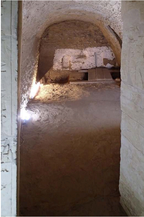
Fig. 7. Complexe funéraire TG 3 : voûte restaurée de la chapelle funéraire T12 (décembre 2019) ; vue de l'est vers l'ouest (V. Dobrev).