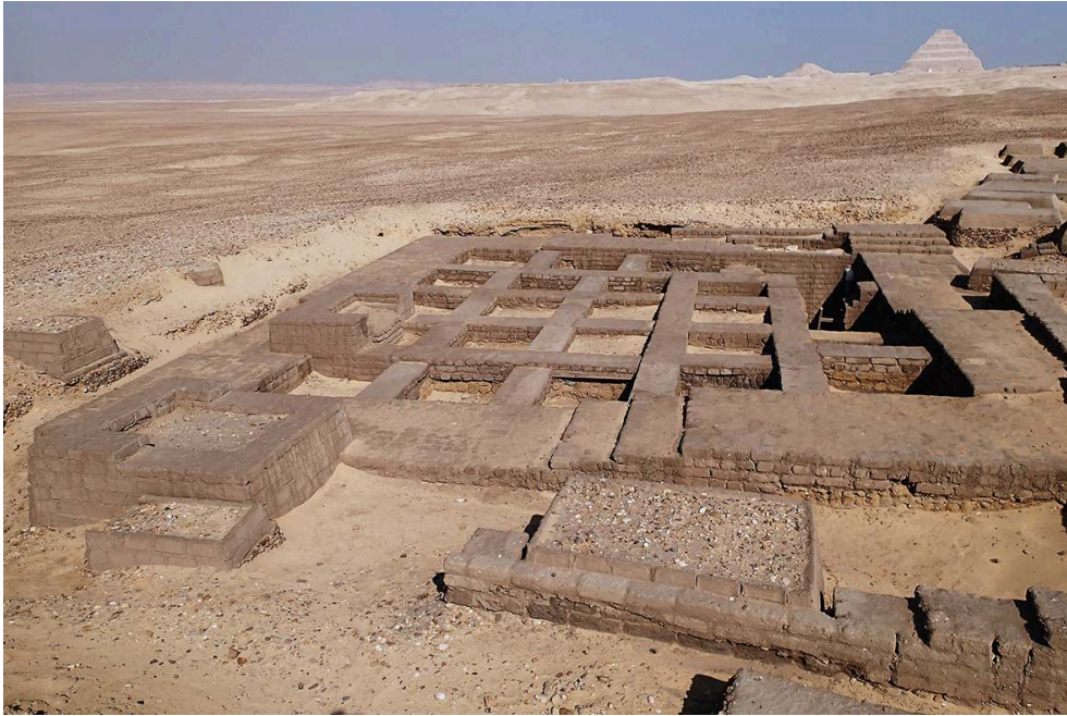
Fig. 2. Grande structure en brique crue M 55 après restauration (janvier 2019) ; vue du sud au nord (V. Dobrev).