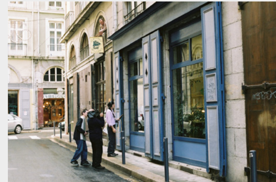
Caméra à l'épaule, Raymond Depardon filme, avec une Aaton 35 III, Jean-Pierre Beauviala devant l'atelier de mécanique d'Aaton, rue de la Paix. La caméra a été transformée en 2Perf, format destiné à la caméra Penelope encore en cours de conception - Photo Valentina Miraglia.

Le constructeur Pierre Michoud répond à toutes les questions des cinéastes. Raymond Depardon est bien là. Équipé d'une Aaton 35 III, il teste le format 35 mm 2Perf destiné ultérieurement à la caméra Penelope. Le test prend la forme d'un tournage à pied dans Grenoble.