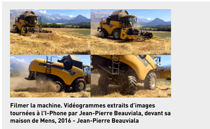
Filmer la machine. Vidéogrammes extraits d'images tournées à l'i-Phone par Jean-Pierre Beauviala, devant sa maison de Mens, 2016 - Jean-Pierre Beauviala

Un petit Canon numérique te tombe sous la main, tu penses qu'un capteur au format Super 16 est largement suffisant pour réaliser de bonnes images. Plus c'est trop. Petit et mobile, toujours, comme ton nouveau projet de caméra Libellule. Tu as envie de rester, de tarder. On boit du jus de pomme en silence jusqu'à ce que la lumière tombe.