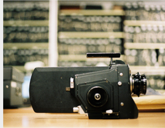
La caméra 8-35, vue côté moteur, avec sa valise. Photographie prise au Conservatoire des techniques de la Cinémathèque française, BNF