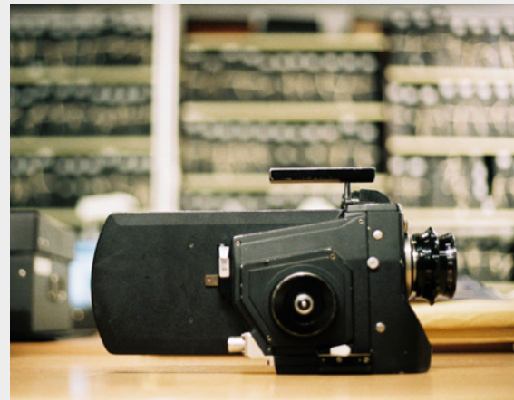
La caméra 8-35, vue côté moteur, avec sa valise. Photographie prise au Conservatoire des techniques de la Cinémathèque française, BNF - Photo Valentina Miraglia.

La rencontre et les échanges avec Jean-Pierre Beauviala et son équipe marquent un tournant dans mes travaux de recherche. Avec les encouragements de Laurent Mannoni de la Cinémathèque française, je termine en 2012 une thèse de doctorat où je propose une nouvelle lecture de l'histoire du cinéma léger en analysant les répercussions esthétiques et pratiques des contraintes techniques sur la mise en scène. Pour ouvrir, délimiter et approfondir un champ de réflexion sur la genèse des caméras, j'approche l'histoire de la prise de vue légère en définissant un corpus d'étude sur un siècle de caméras, depuis le fusil chronophotographique de Etienne-Jules Marey jusqu'à la caméra numérique RED. Il va sans dire que les caméras Aaton sont en bonne place dans cette étude.