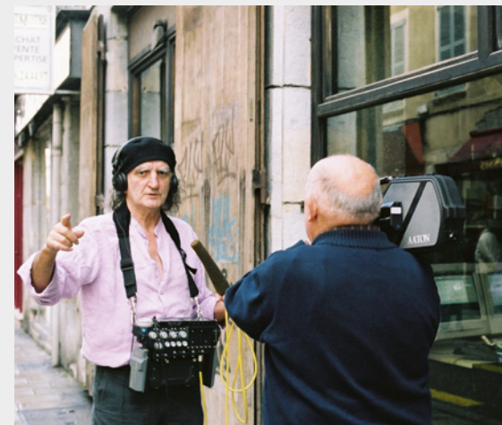
Jean-Pierre Beauviala équipé d'un enregistreur son Cantar et Raymond Depardon en train de le filmer, rue Bayard, devant l'atelier d'électronique d'Aaton - Photo Valentina Miraglia.