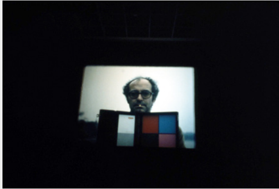
Projection des premiers essais tournés avec le prototype 8-35 dans une salle de cinéma de Grenoble, le 21 mai 1979 - Photo Bruno Carrière.

Après le visionnement, nous avons pu échanger avec Lubtchansky qui était déjà à cette époque un directeur de la photographie très réputé. Pour nous, c'était une chance inespérée d'écouter un artisan de cette trempe. Âgé de 42 ans, il avait déjà signé la photo de plus d'une trentaine de longs métrages. C'était en quelque sorte une superstar de la caméra pour son époque. Lorsqu'il s'est retiré en 2013, Lubtchansky avait 110 films au compteur.