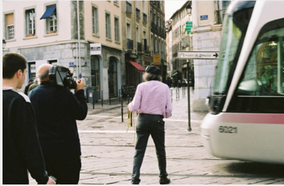
Déambulation dans la ville de Grenoble, sans fil à la patte !