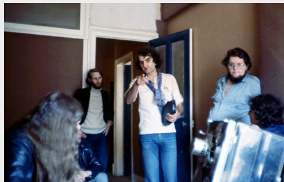
Un groupe de jeunes cinéastes en visite à Aaton le 21 mai 1979.

Nous descendons d'abord la rue Bayard – une rue marchande du vieux centre-ville – pour prendre la petite rue de la Paix, occupée des deux côtés par Aaton et s'arrêter devant le 2. On se trouve alors face au siège social de la Société. L'immeuble ancien, avec des logements au-dessus et des commerces au niveau de la rue, fait six étages et n'a rien de remarquable. La devanture du rez-de-chaussée est peinte en bleu avec la mention AATON en grandes lettres noires. Si on ne sait pas qu'il s'agit d'un fabricant de caméras, nul moyen