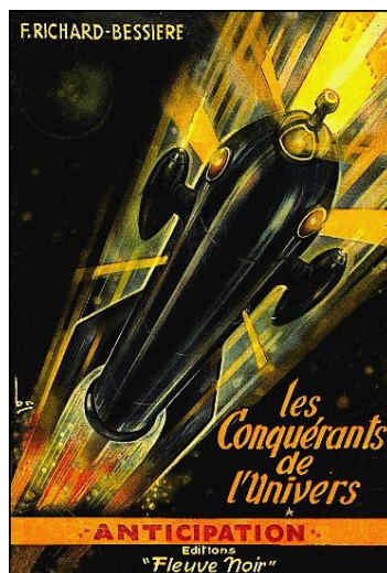
Figure 1 : Exemple de couverture

On connaît Richard Bessière par quelques études sur son œuvre, et par une autobiographie qu'il a rédigée quelques années avant sa disparition [BES 05]. Richard Bessière a vécu à Béziers de 1923 à 2011.