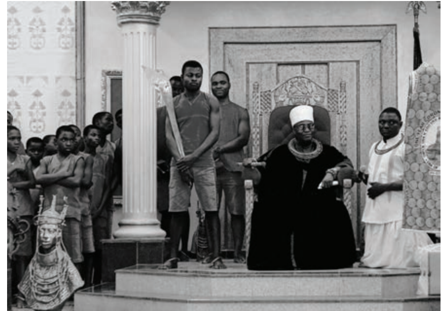
Ewuare II, Oba de Benin - Nigéria - Septembre 2018

S'il est clair, on l'a vu, que l'Oba est un personnage sacré, il apparaît plus incertain de dire si l'on doit considérer les priests comme personnages sacrés ou comme de simples agents chargés d'accomplir les rites.