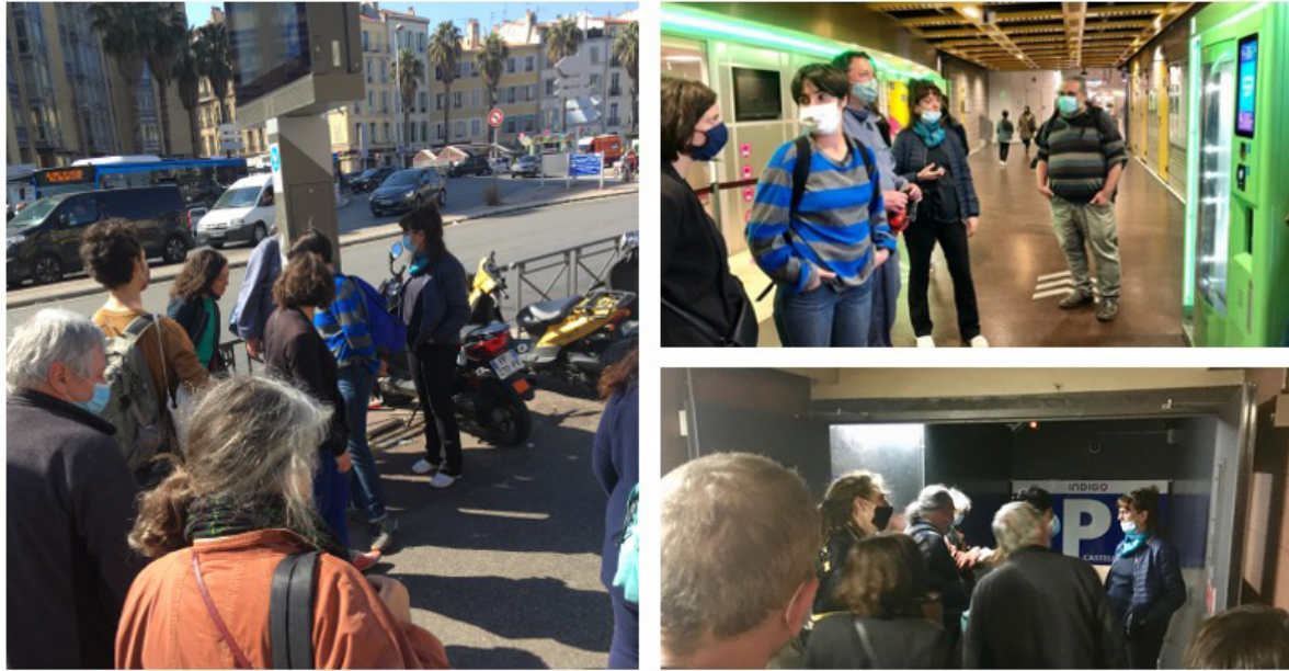
Illustration 3 : Balade autour de la station de métro Castellane à Marseille