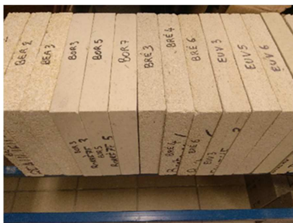
Figure 3 : Quelques éprouvettes de pierres sélectionnées.

Suite à ces études préliminaires, l'objectif est de déterminer les caractéristiques thermiques et hydriques des roches. Une douzaine de pierres représentatives de leur utilisation dans la construction de bâtiments en France ont été sélectionnées (Figure 3). En thermique du bâtiment, les propriétés les plus importantes à connaître sont la conductivité et la capacité thermiques, qui varient en fonction de la teneur en eau et de la température [3]. Pour nos échantillons, les conductivités thermiques mesurées varient de 0.55 à 1.30 W/(m.K) à l'état sec et de 0.95 à 1.55 W/(m.K) à saturation. Les capacités thermiques massiques varient quant à elles de 630 à 720 J/(kg.K) à sec et de 700 à 1300 J/(kg.K) à saturation. La chaleur volumique, produit de la capacité thermique massique par la masse volumique s'exprime en J/(m 3 .K) et caractérise la capacité du matériau à stocker et à déstocker de la chaleur. Pour les pierres analysées, les valeurs varient de 1510 à 2000 kJ/(m 3 .K) à sec et de 1600 à 2400 kJ/(m 3 .K) à saturation.