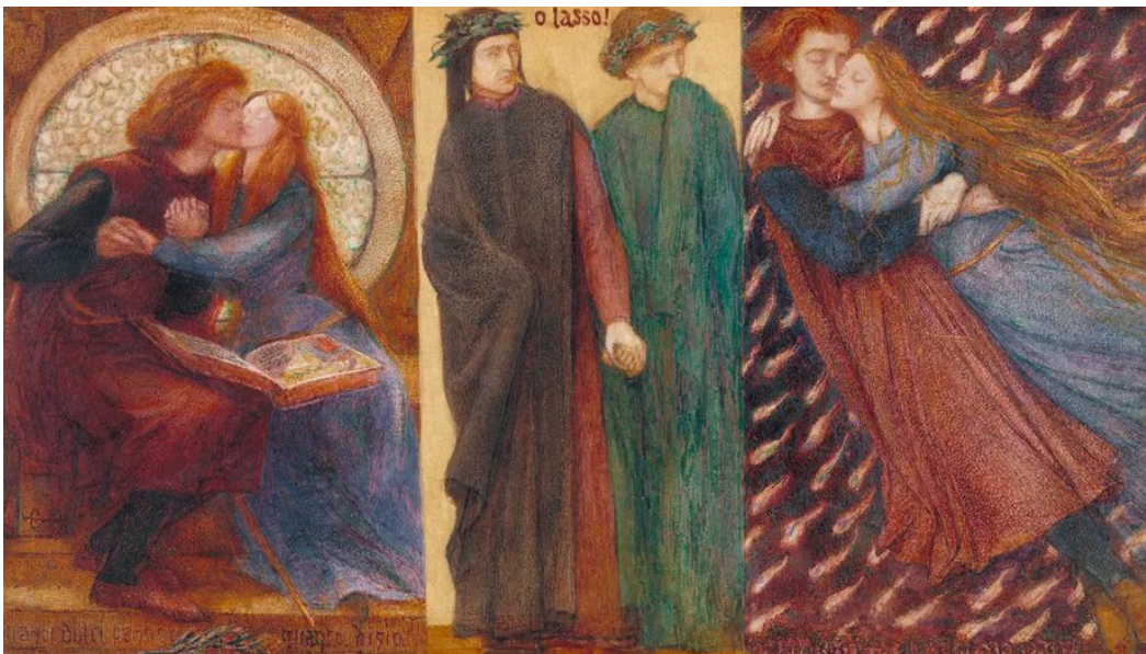
Dante Gabriel Rossetti, Paolo and Francesca da Rimini, 1855. Tate Gallery